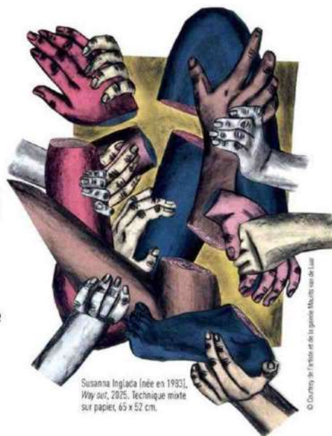
Susanna Inglada (née en 1993), Way out , 2025. Technique mixte sur papier, 65 x 52 cm.

“ Figures historiques et expérimentations contemporaines se côtoient dans cette nouvelle édition.