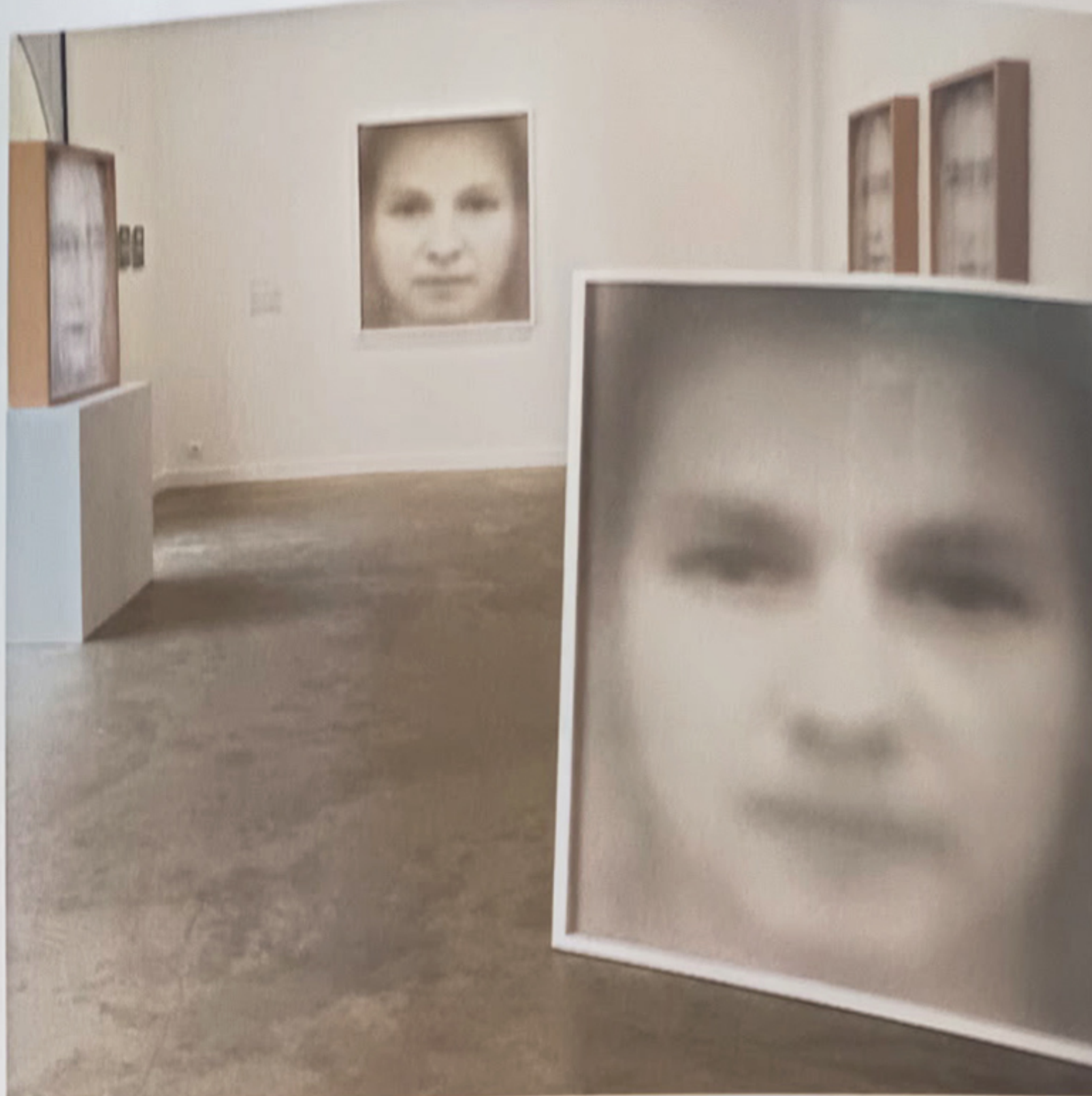
Capture , œuvre évolutive. Captures d'écran analogiques de 100 à 450 visages superposés. Tirage platine-paladium sur papier coton, 133 x 106 cm. © Laurent Lafolie

des propositions trop poussées pour que les photographes prennent position. Ils vont me dire: « Ah non, là c'est trop... », ou « Ah oui, c'est ça! » L'auteur se place et saisit ce qui le concerne. On rencontre ainsi le sujet. J'ai par ailleurs appris à tirer à l'agrandisseur en mettant mes mains dans le faisceau de lumière. Aujourd'hui, sur Photoshop, je fais exactement les mêmes gestes avec des masques et des courbes. L'avantage du numérique, c'est qu'on peut interpréter sur un temps long. J'ouvre une image dix minutes, je la ferme, j'y reviens le lendemain. Ça évite d'être tributaire de l'humeur du moment.