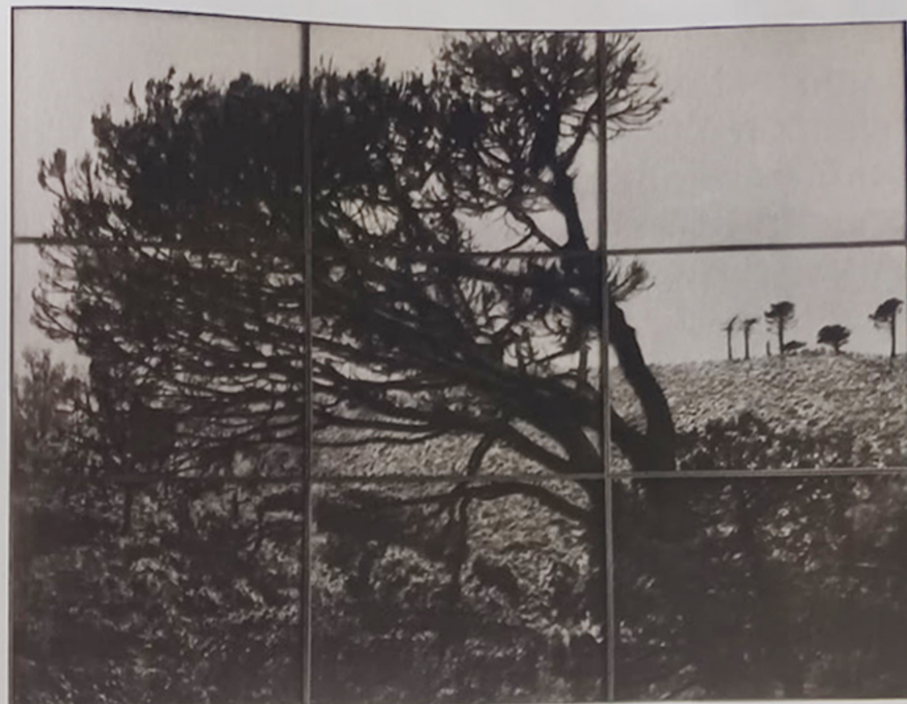
BLANK, œuvres uniques. 15 images 180 × 225 cm, gravure laser sur carton gris recyclé. © Laurent Lafolie

Fabrice Laroche : Comment la relation à la matière influence-t-elle votre pratique artistique ?