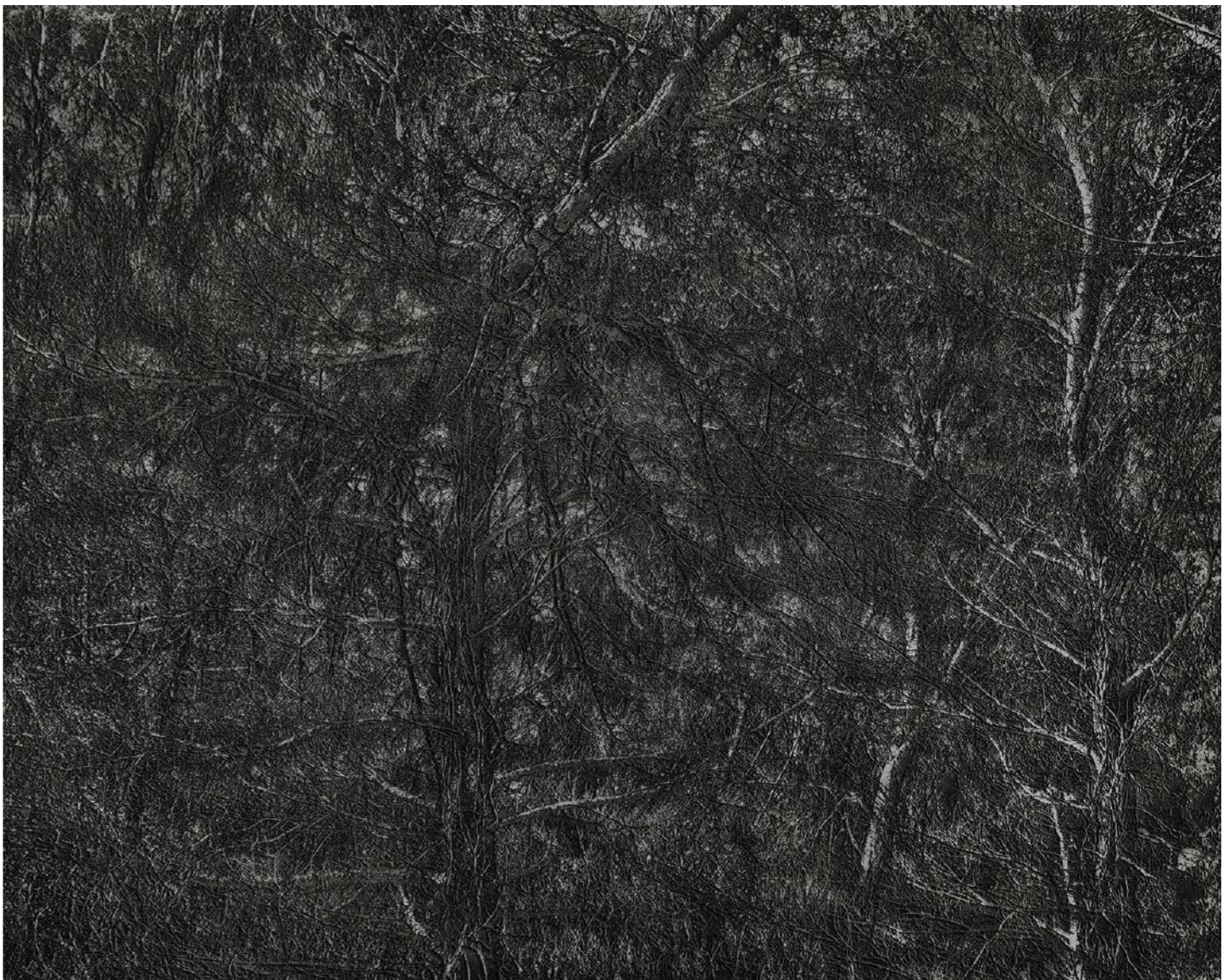
Laurent Lafolie, #09, série .BLANK, 2024 gravure laser sur carton recyclé d'après photographie à la chambre 4x5 contrecollage sur dibond, encadrement et verre antireflet épreuve unique - édition 1/3 - 60 x 75 cm