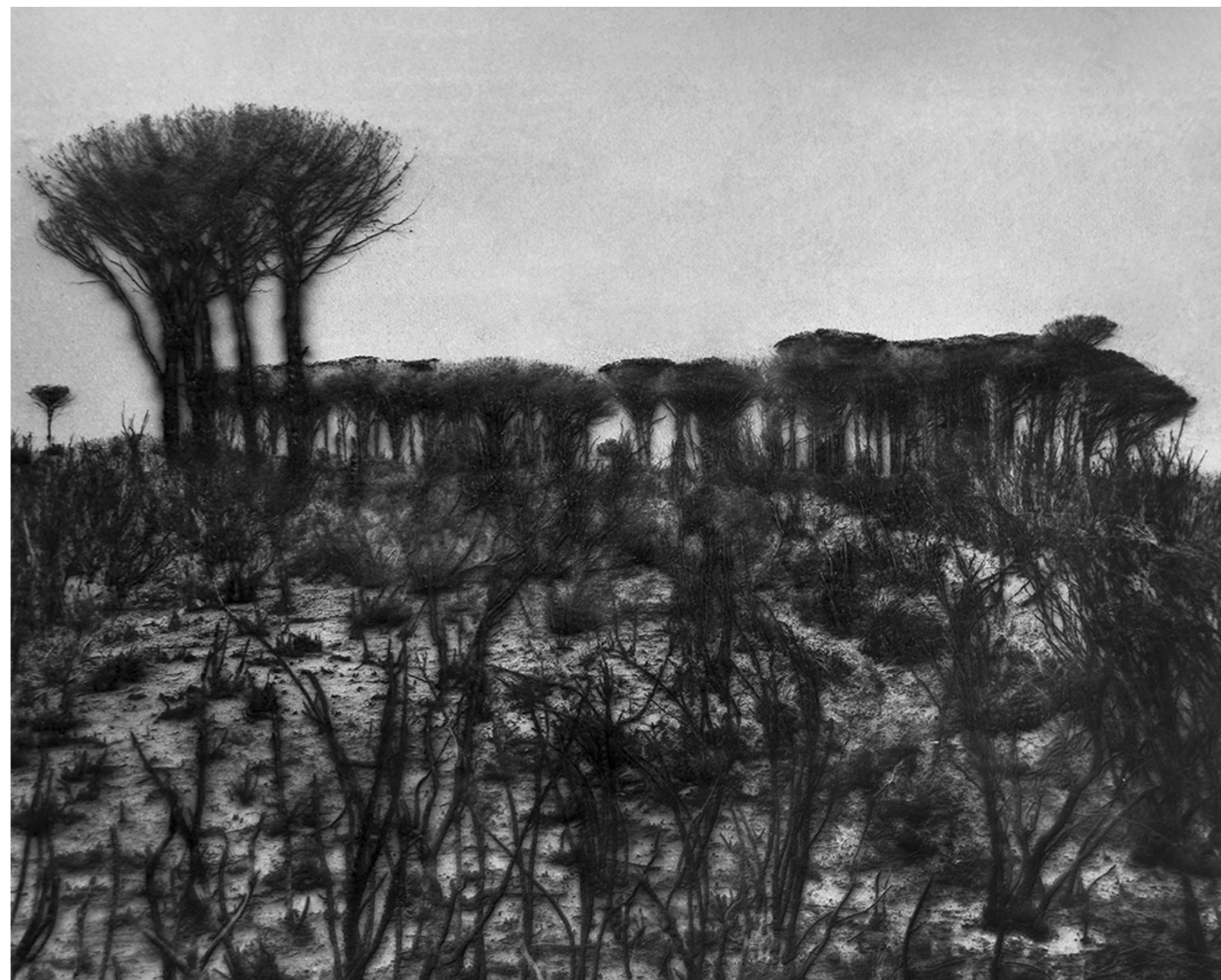
Laurent Lafolie, #014, série .BLANK, 2024 gravure laser sur carton recyclé d'après photographie à la chambre 4x5 contrecollage sur dibond, encadrement et verre antireflet épreuve unique - édition 1/3 - 60 x 75 cm