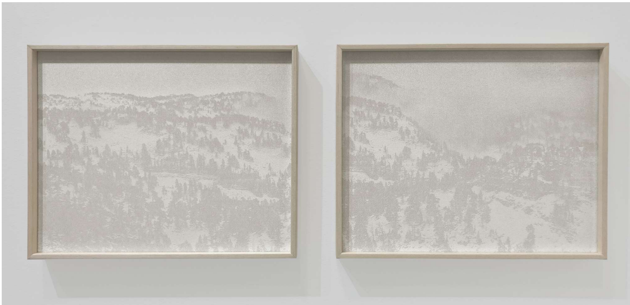
Laurent Lafolie, diptyque #01 & #02, série .blanc, 2023 gravure laser sur papier pur coton d'après photographie à la chambre 4x5 encadrement aluminium plaqué bois, entre deux verres antireflet diptyque - 2 x 25 x 31 x 3,5 cm - édition 2/5 (+2EA)