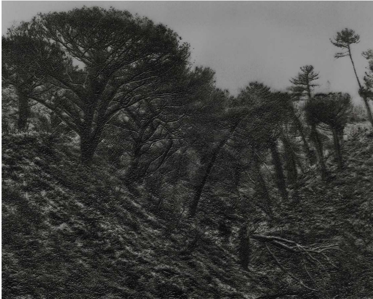
Laurent Lafolie, #03, série .BLANK, 2024 gravure laser sur carton recyclé d'après photographie à la chambre 4x5 contrecollage sur dibond, encadrement et verre antireflet épreuve unique - édition 2/3 - 60 x 75 cm