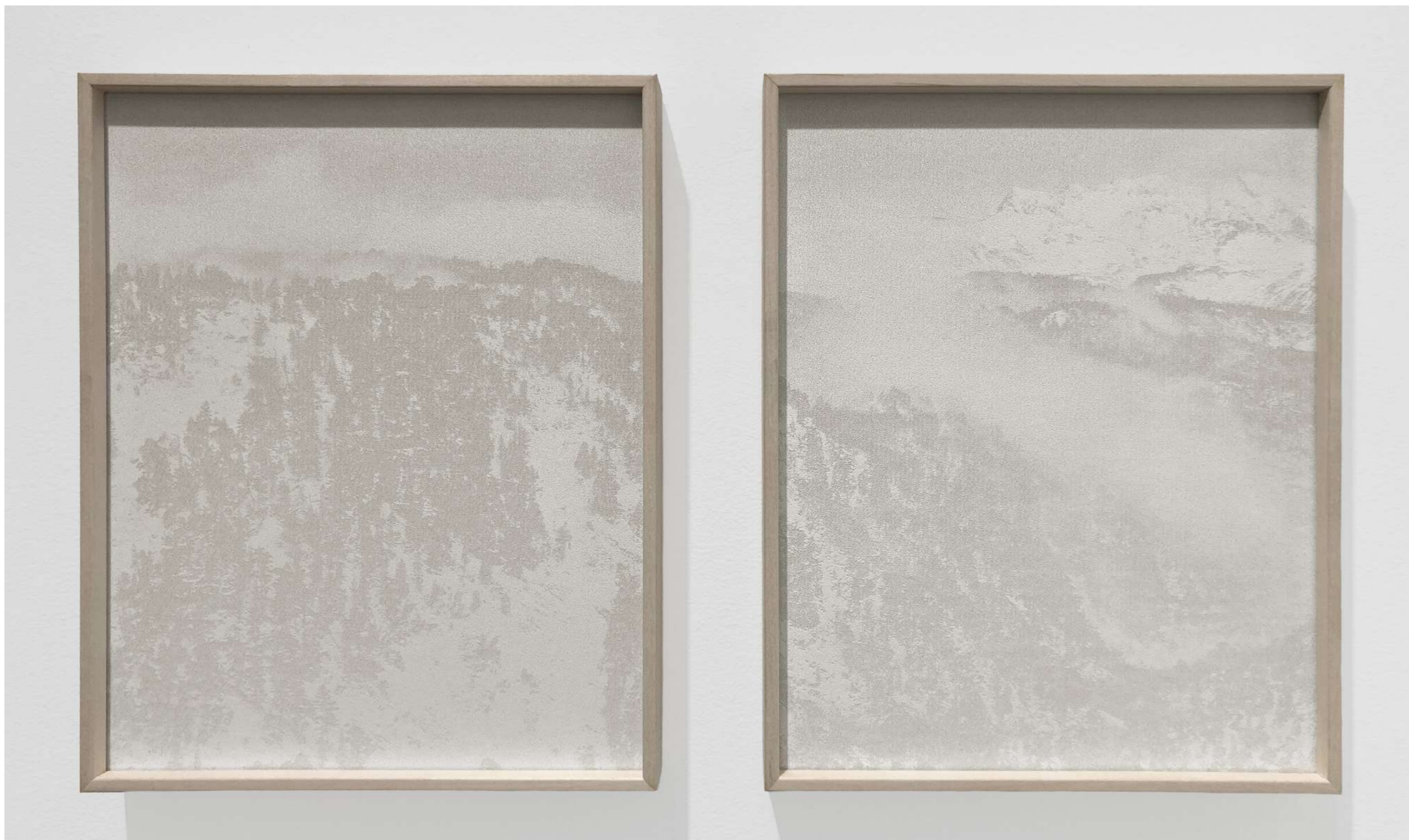
Laurent Lafolie, diptyque #04 & #05, série .blanc, 2023 gravure laser sur papier pur coton d'après photographie à la chambre 4x5 encadrement aluminium plaqué bois, entre deux verres antireflet 2 x 31 x 25 x 3,5 cm - édition 5/5 (+2EA)