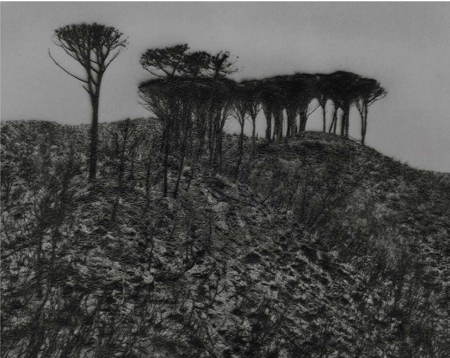
Laurent Lafolie, #02, série .BLANK, 2024 gravure laser sur carton recyclé d'après photographie à la chambre 4x5 contrecollage sur dibond, encadrement et verre antireflet épreuve unique - édition 3/3 - 60 x 75 cm