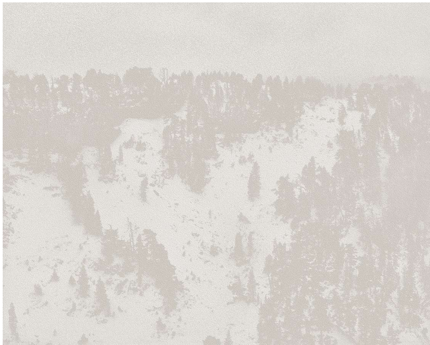
Laurent Lafolie, #03, série .blanc, 2023 gravure laser sur papier pur coton d'après photographie à la chambre 4x5 encadrement aluminium plaqué bois, entre deux verres antireflet 25 x 31 x 3,5 cm - édition 1/5 (+2EA)