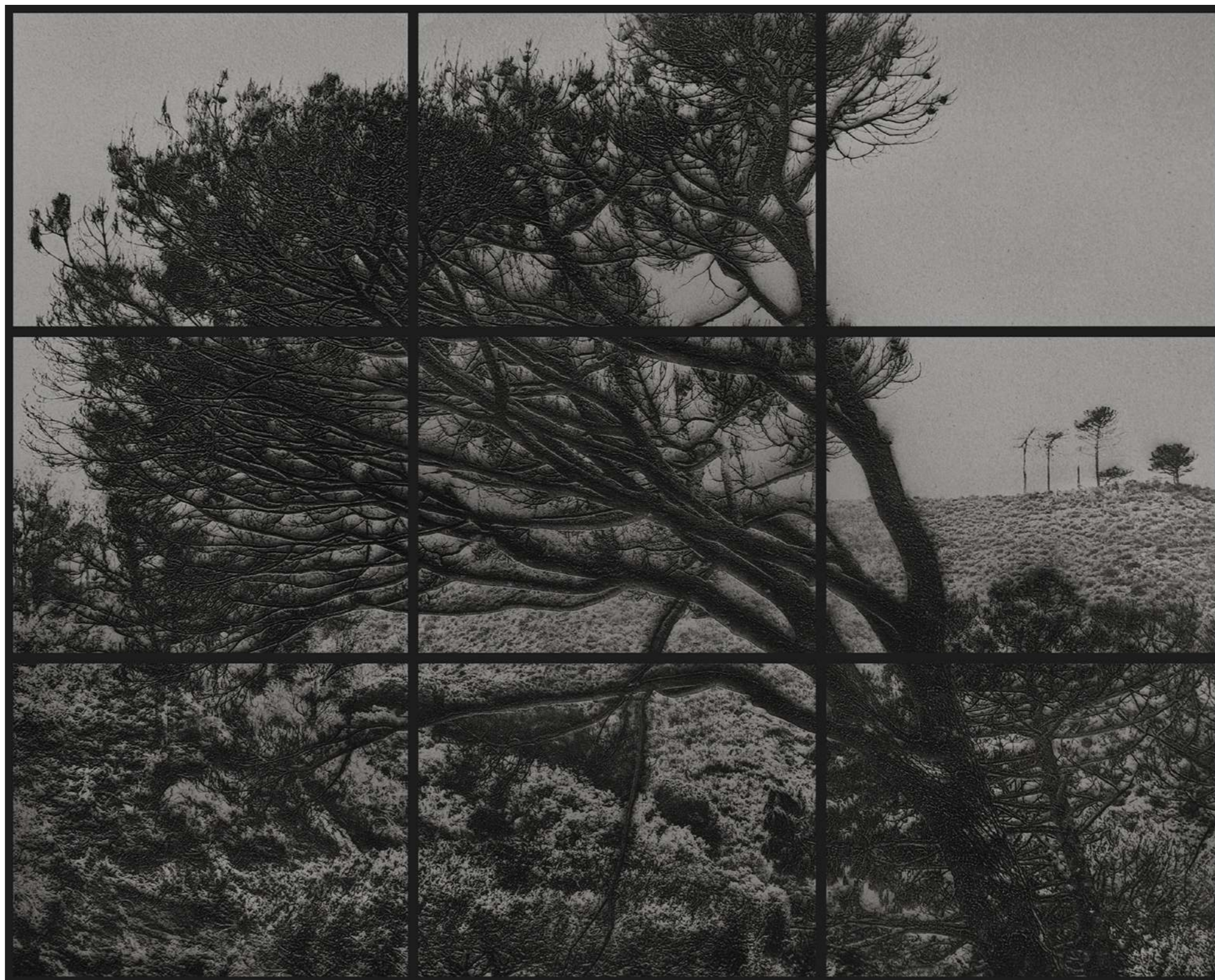
Laurent Lafolie, #04.9, série .BLANK, 2025 gravure laser sur carton recyclé d'après photographie à la chambre 4x5 contrecollage sur dibond, encadrement et verre antireflet ensemble de 9 panneaux - 180 x 225 cm épreuves uniques dans une édition de 2 (+1EA)