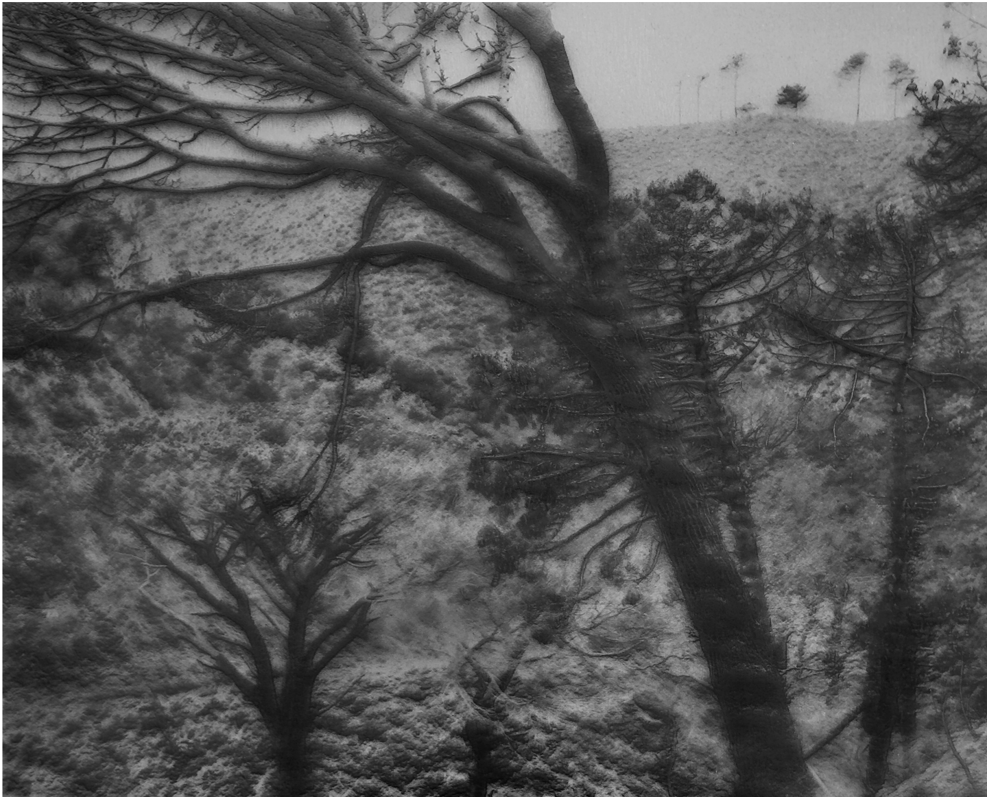
Laurent Lafolie, #20, série .BLANK, 2024 gravure laser sur carton recyclé d'après photographie à la chambre 4x5 contrecollage sur dibond, encadrement et verre antireflet épreuve unique - édition 1/3 - 60 x 75 cm