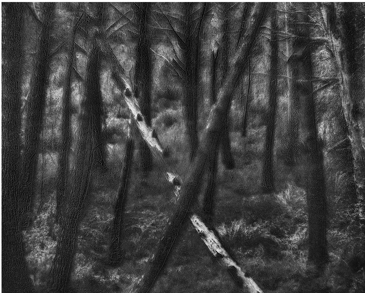
Laurent Lafolie, #13, série .BLANK, 2024 gravure laser sur carton recyclé d'après photographie à la chambre 4x5 contrecollage sur dibond, encadrement et verre antireflet épreuve unique - EA1 - 60 x 75 cm