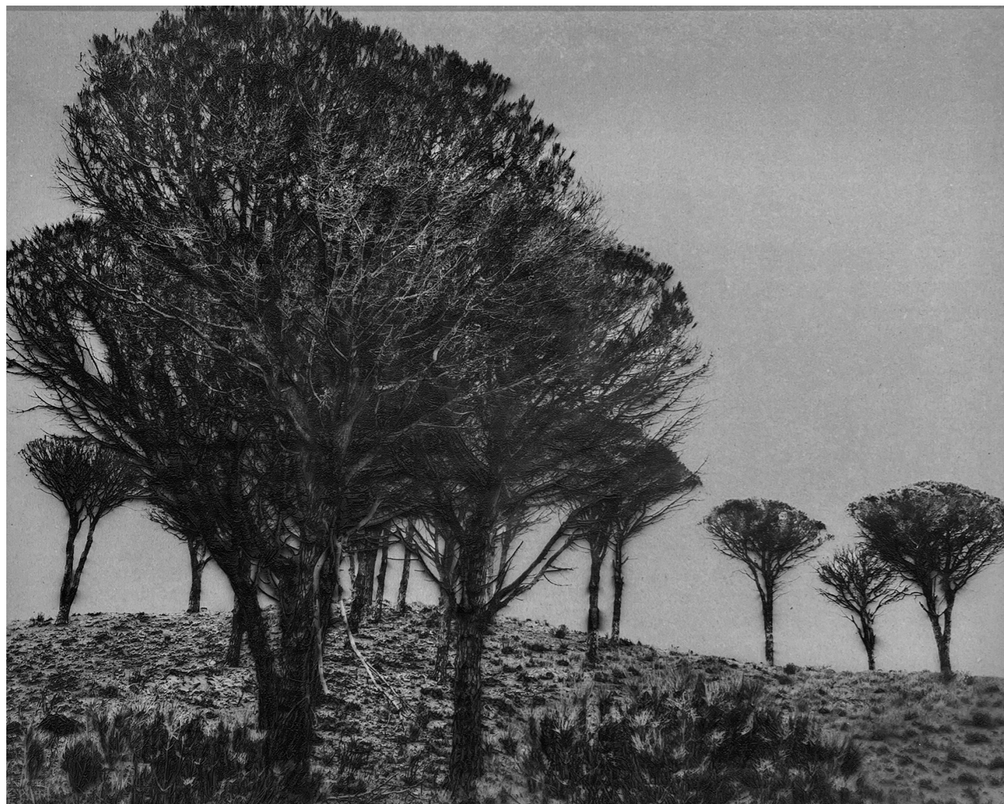
Laurent Lafolie, #12, série .BLANK, 2024 gravure laser sur carton recyclé d'après photographie à la chambre 4x5 contrecollage sur dibond, encadrement et verre antireflet épreuve unique - édition 3/3 - 60 x 75 cm