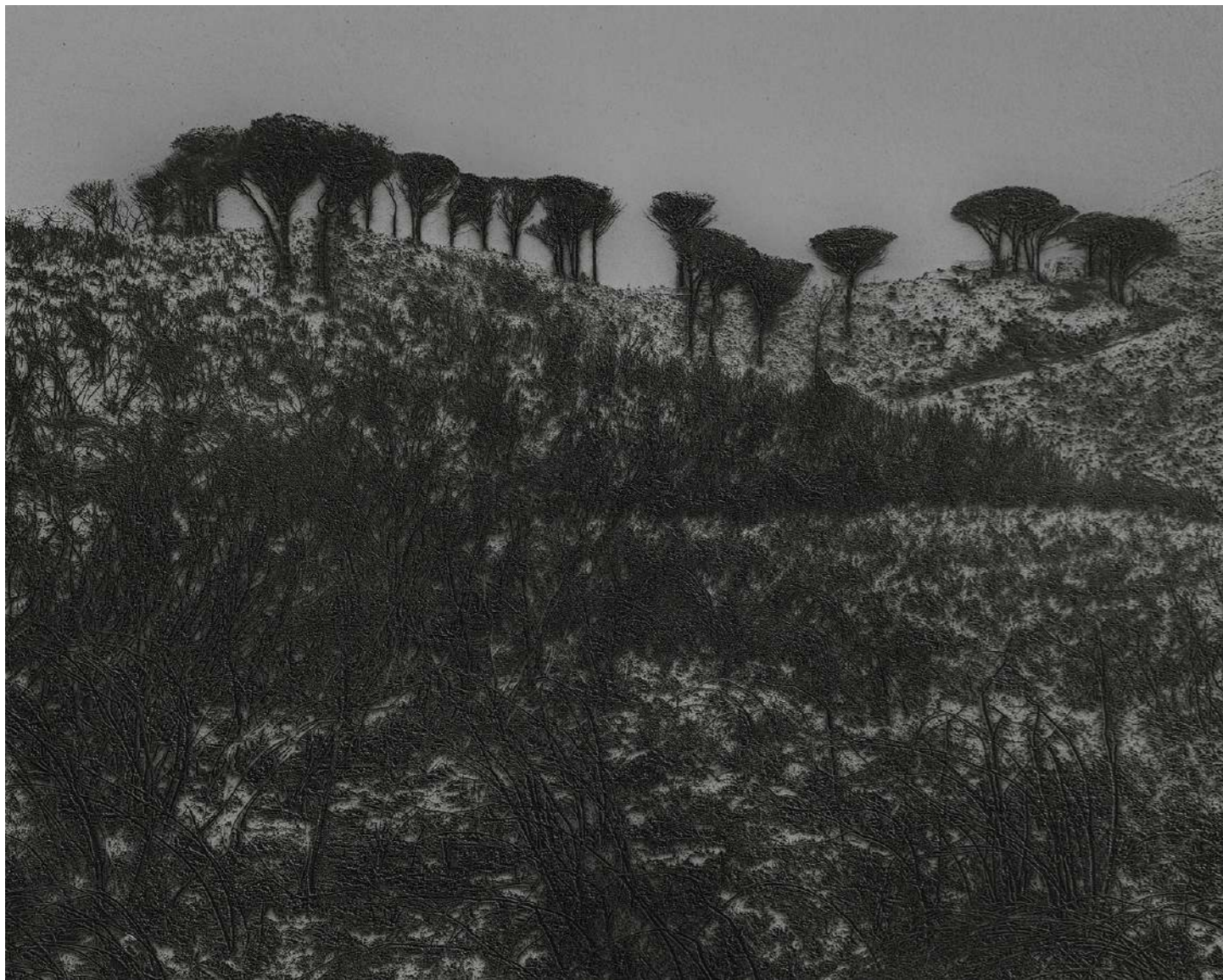
Laurent Lafolie, #08, série .BLANK, 2024 gravure laser sur carton recyclé d'après photographie à la chambre 4x5 contrecollage sur dibond, encadrement et verre antireflet épreuve unique - édition 1/3 - 60 x 75 cm