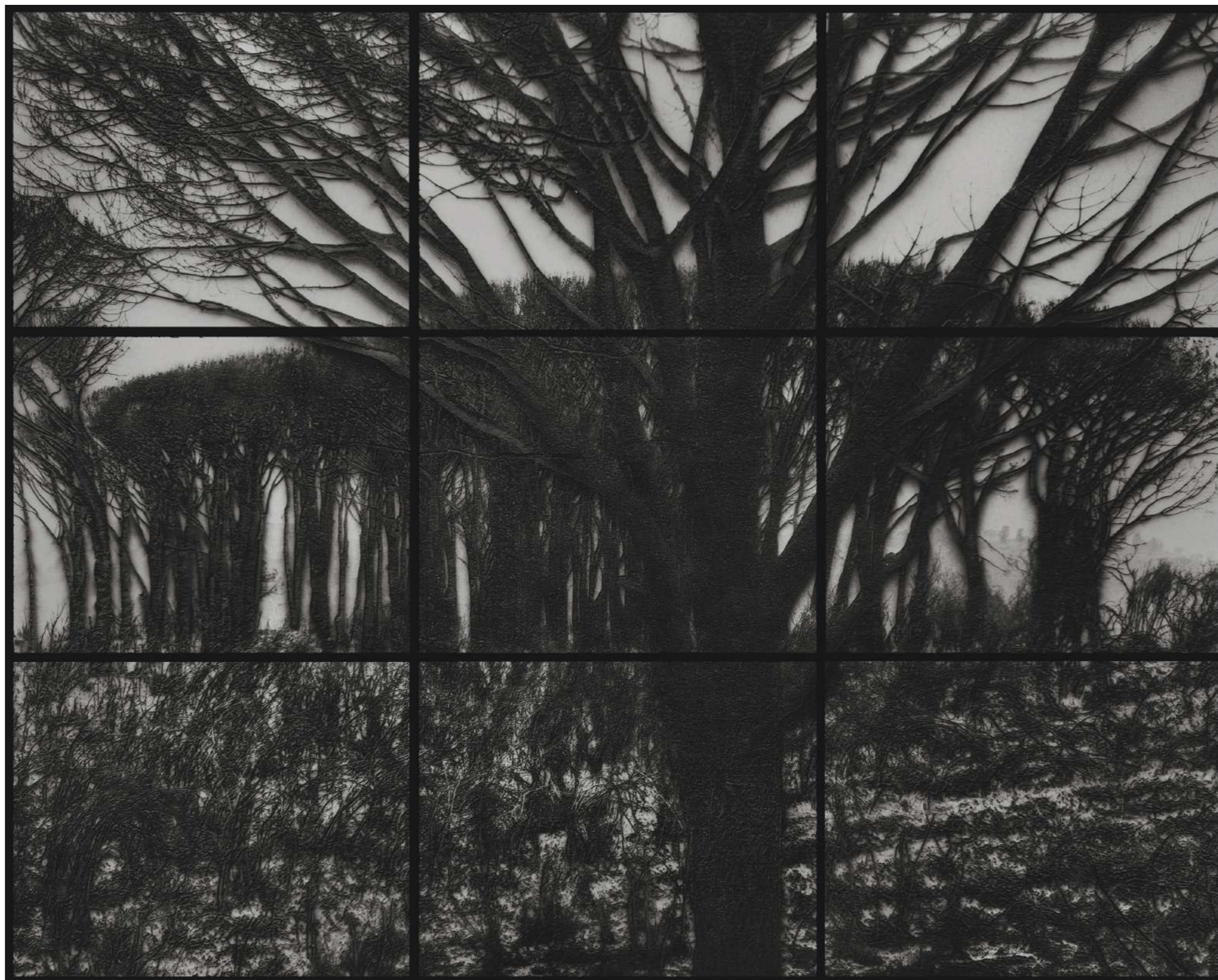
Laurent Lafolie, #01.9, série .BLANK, 2025 gravure laser sur carton recyclé d'après photographie à la chambre 4x5 contrecollage sur dibond, encadrement et verre antireflet ensemble de 9 panneaux - 180 x 225 cm épreuves uniques dans une édition de 2 (+1EA)