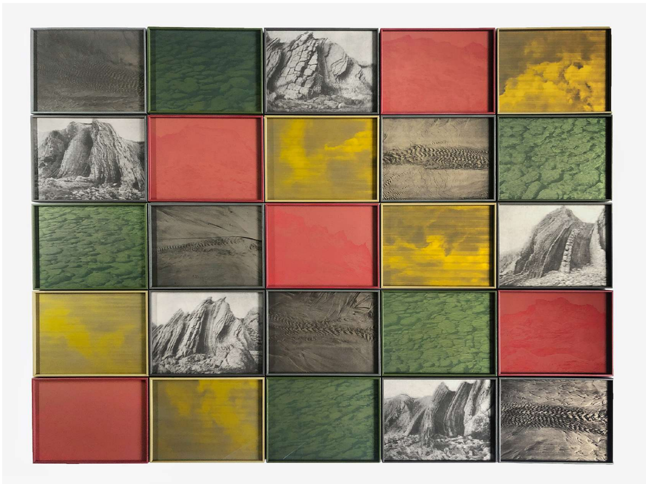
Laurent Lafolie, OI L'origine des images, 2020 œuvre en 25 panneaux composés de 5 séries de 5 images pigments sur plaques photopolymères gravées et feuilles de washi encadrement en métal peint et verre antireflet épreuve unique - édition de 1/3 (+2EA) – 130 x 170 cm