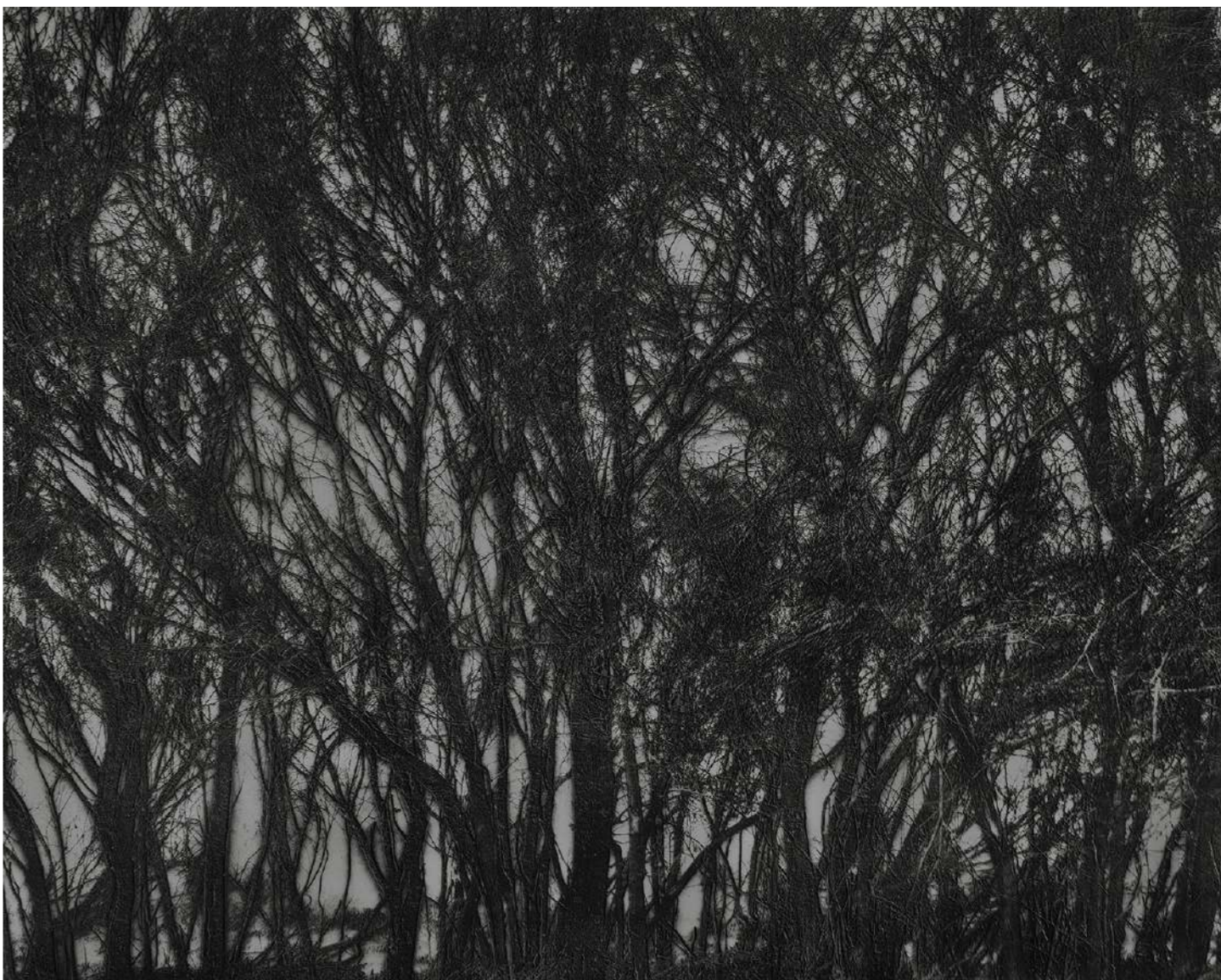
Laurent Lafolie, #07, série .BLANK, 2024 gravure laser sur carton recyclé d'après photographie à la chambre 4x5 contrecollage sur dibond, encadrement et verre antireflet épreuve unique - édition 1/3 - 60 x 75 cm