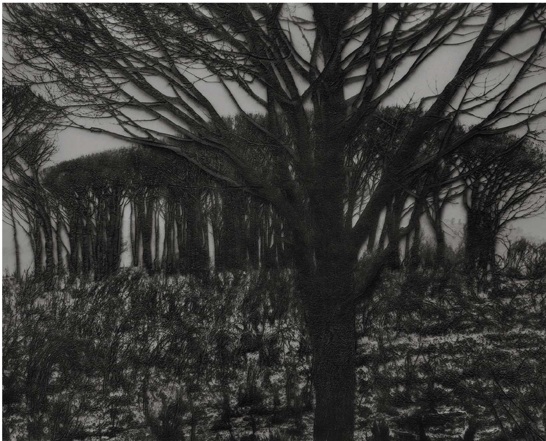
Laurent Lafolie, #01, série .BLANK, 2024 gravure laser sur carton recyclé d'après photographie à la chambre 4x5 contrecollage sur dibond, encadrement et verre antireflet épreuve unique - EA1 - 60 x 75 cm