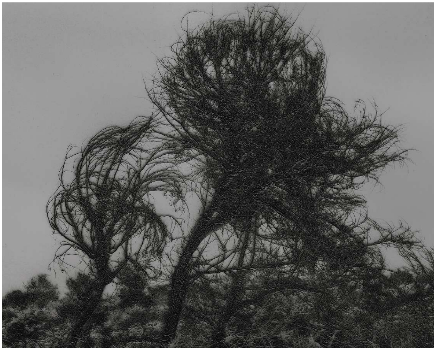
Laurent Lafolie, #06, série .BLANK, 2024 gravure laser sur carton recyclé d'après photographie à la chambre 4x5 contrecollage sur dibond, encadrement et verre antireflet épreuve unique - édition 1/3 - 60 x 75 cm