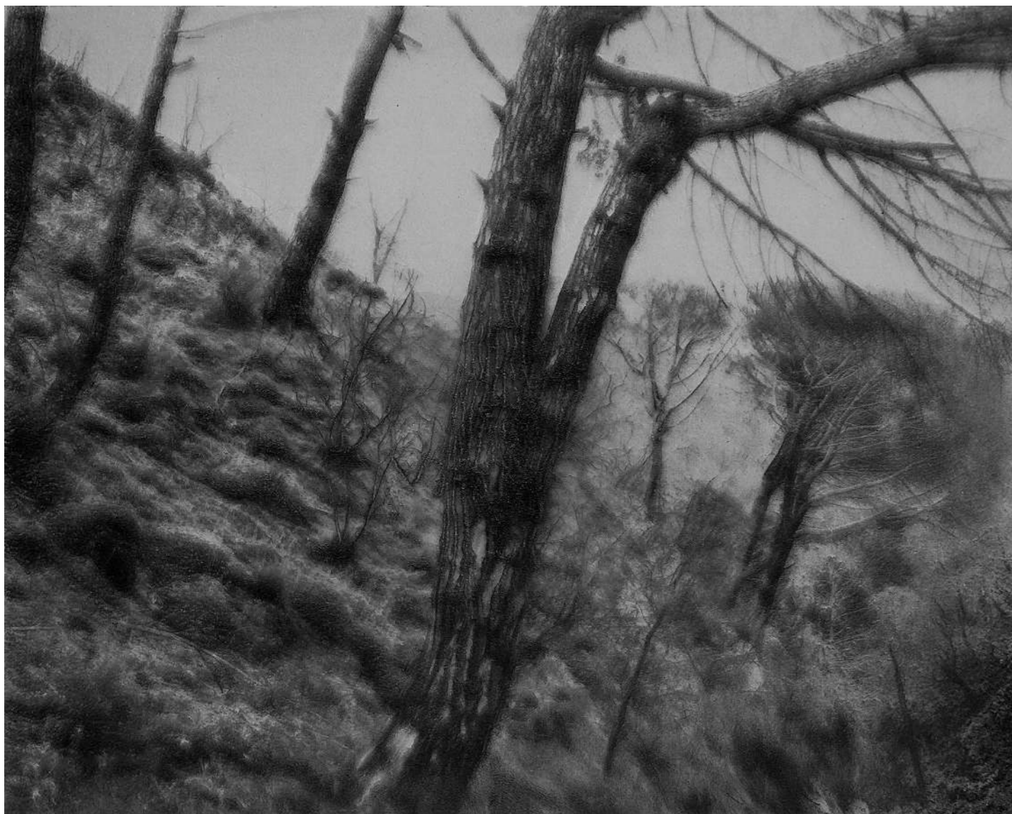
Laurent Lafolie, #15, série .BLANK, 2024 gravure laser sur carton recyclé d'après photographie à la chambre 4x5 contrecollage sur dibond, encadrement et verre antireflet épreuve unique - édition 3/3 - 60 x 75 cm