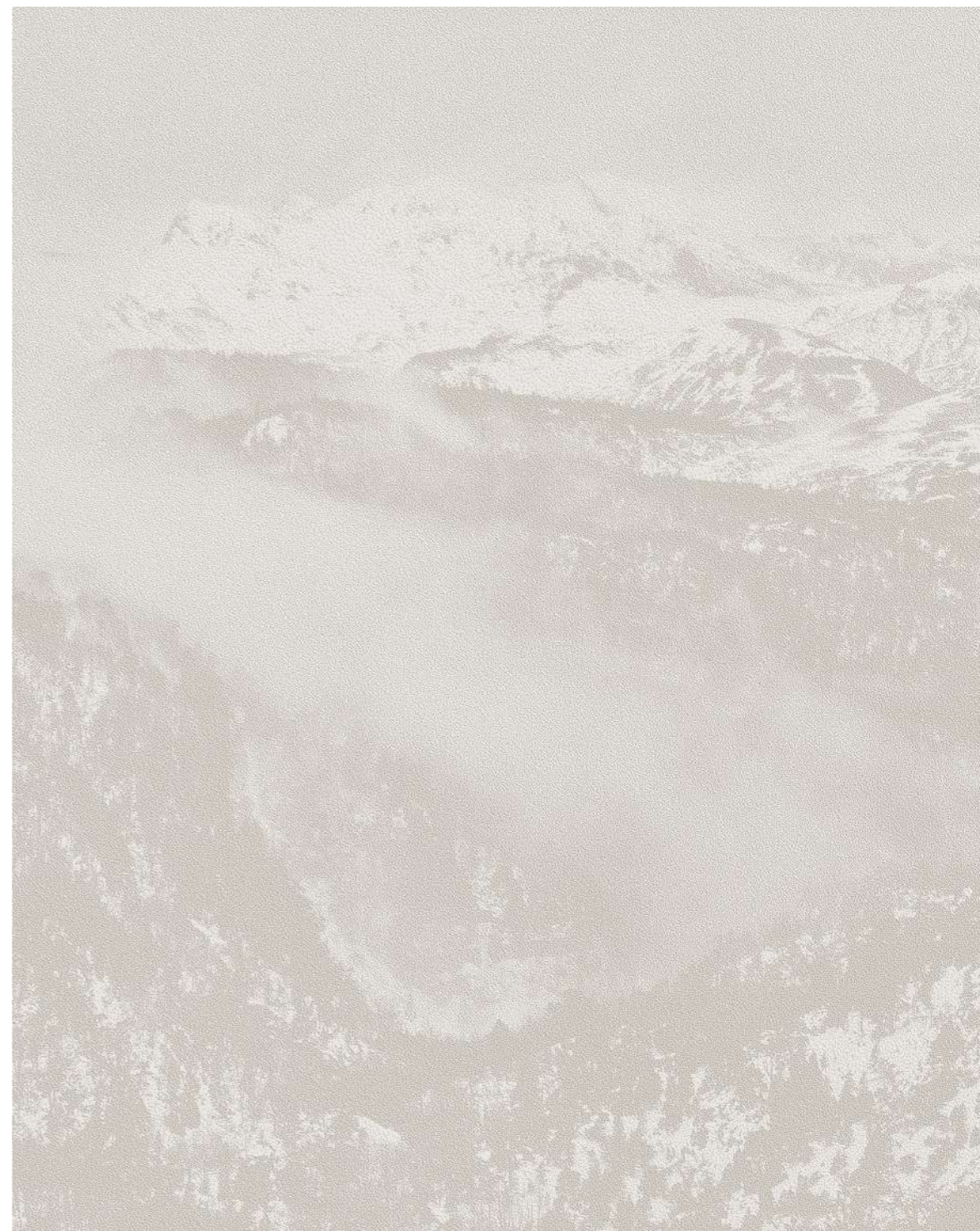
Laurent Lafolie, #06, série .blanc, 2023 gravure laser sur papier pur coton d'après photographie à la chambre 4x5 encadrement aluminium plaqué bois, entre deux verres antireflet 31 x 25 x 3,5 cm - édition 1/5 (+2EA)