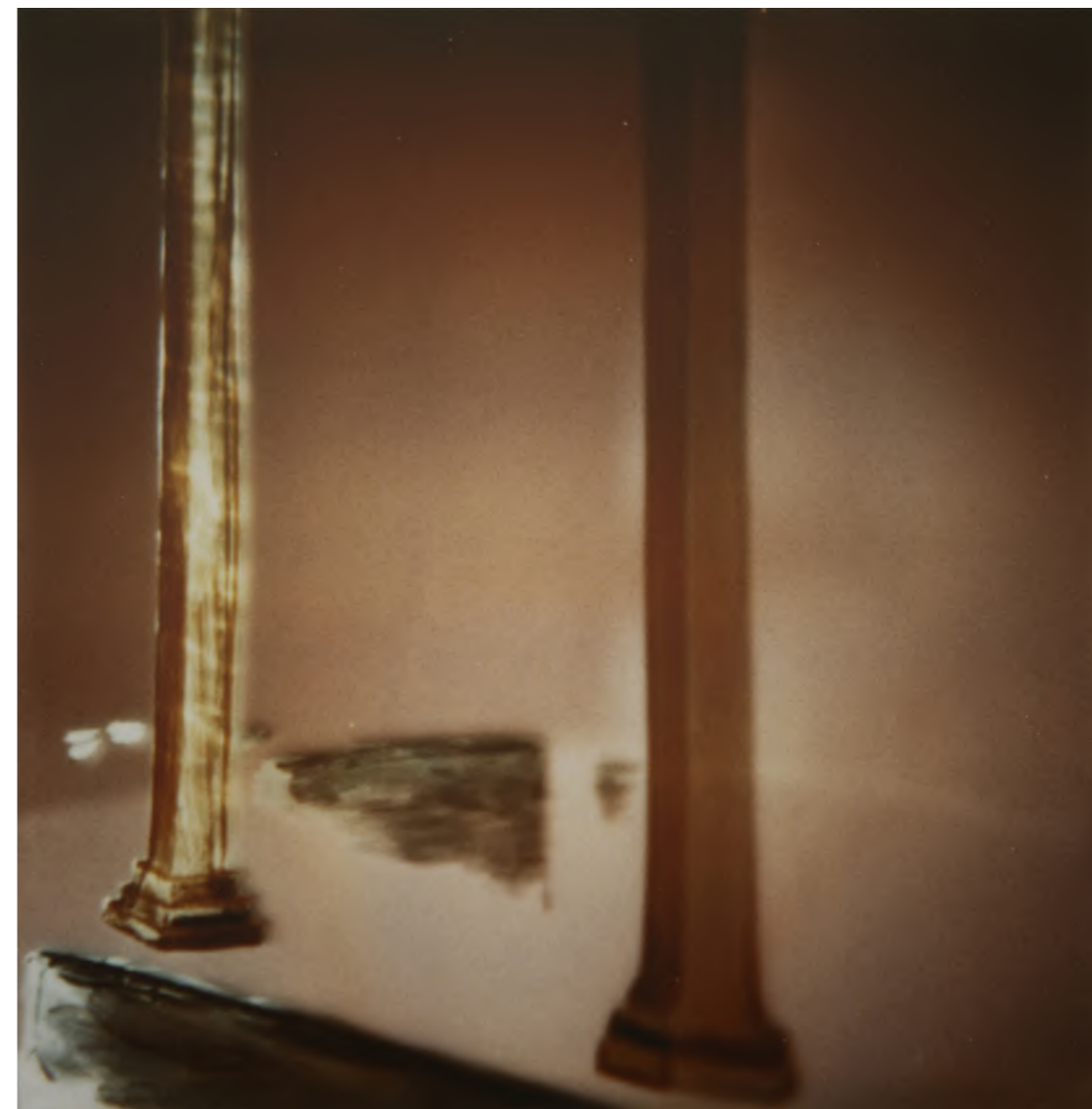
Corinne Mercadier, Deux colonnes, série Polaroids-Photographies, 1985-86 peintures sur verre, polaroid SX70 rephotographié sur film Ekta 4/5 inch tirage Cibachrome, encadrement avec verre antireflets pièce unique - circa 34 x 29 cm