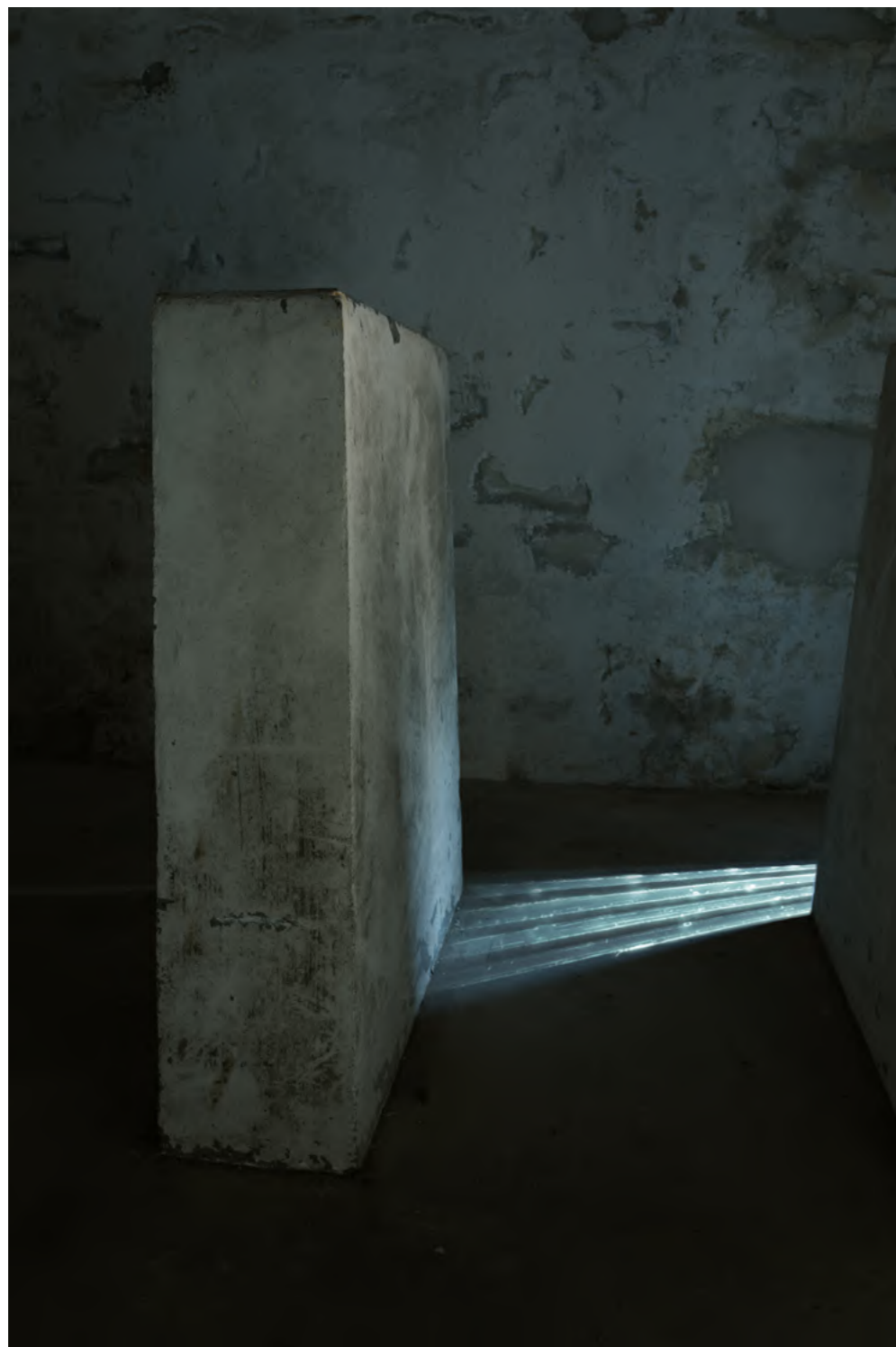
Corinne Mercadier, Une borne à l'infini, série La nuit magnétique, 2022-24

peinture sur verre et photographies tirage sur papier platine fiber rag Canson encadrement bois noir, verre antireflet édition de 5 (+2EA) – 60 x 40 cm