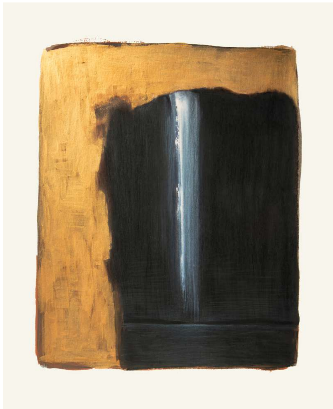
Corinne Mercadier, 20, série Rêves, 2023 encre, gouache, crayon de couleur sur papier Lavis Vinci encadrement et verre antireflet pièce unique - 42,5 x 36 cm