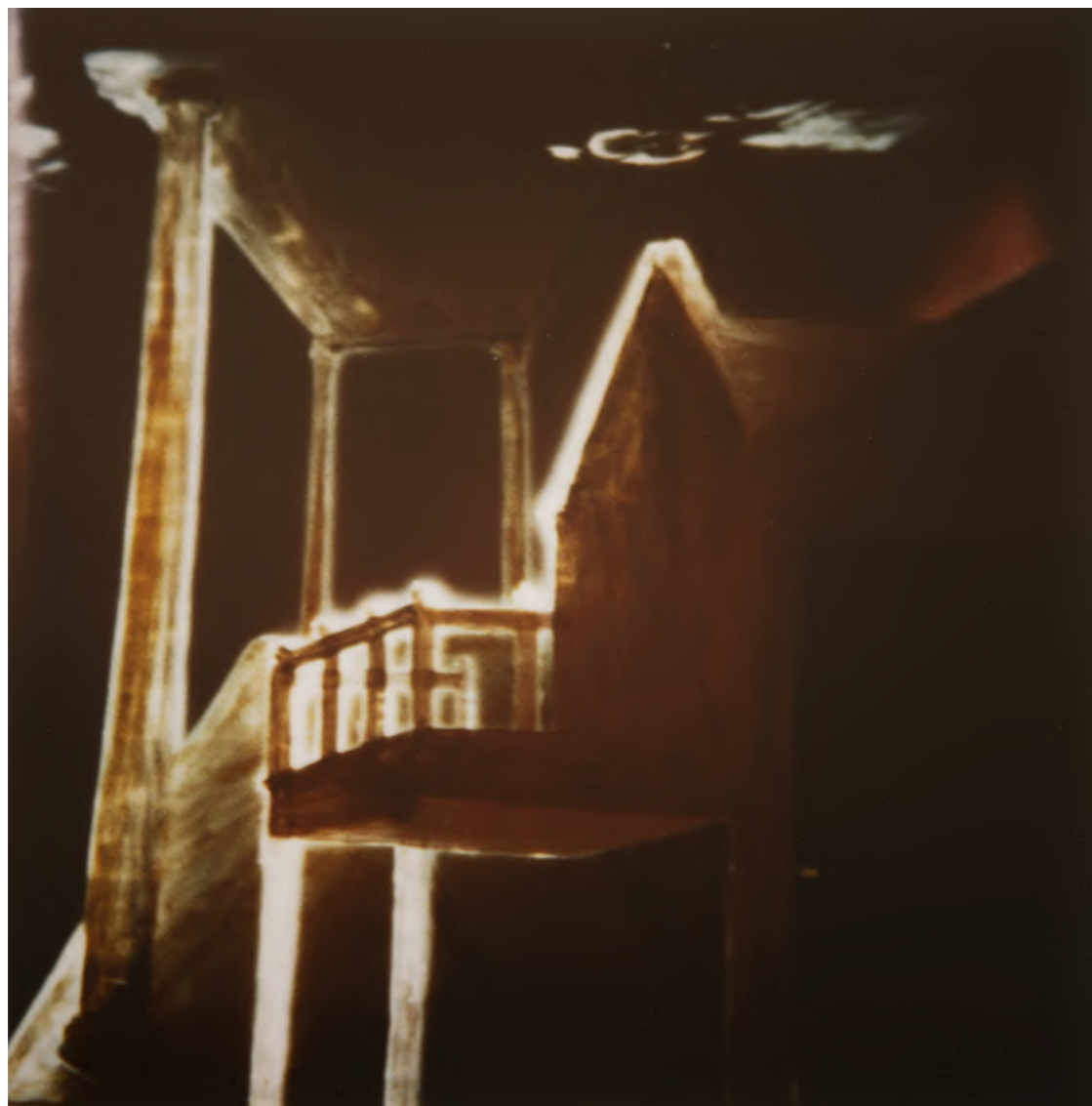
Corinne Mercadier, La maison et le temple, série Polaroids-Photographies, 1985-86 peintures sur verre, polaroid SX70 rephotographié sur film Ekta 4/5 inch tirage Cibachrome, encadrement avec verre antireflets pièce unique - circa 34 x 29 cm