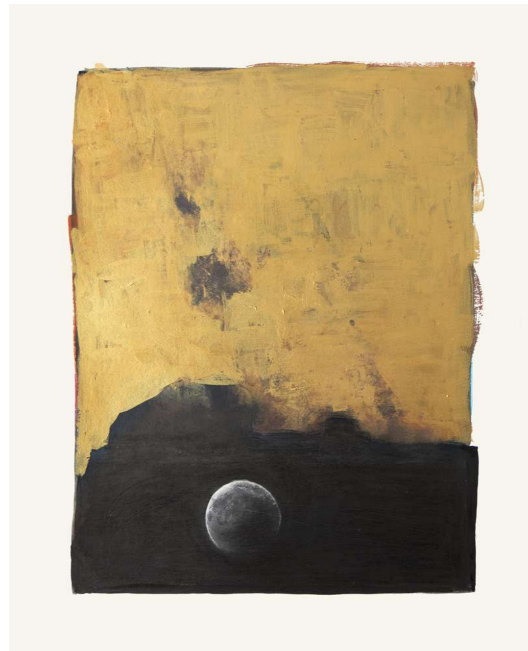
Corinne Mercadier, 30, série Rêves, 2023 encre, gouache, crayon de couleur sur papier Lavis Vinci encadrement et verre antireflet pièce unique - 42,5 x 36 cm