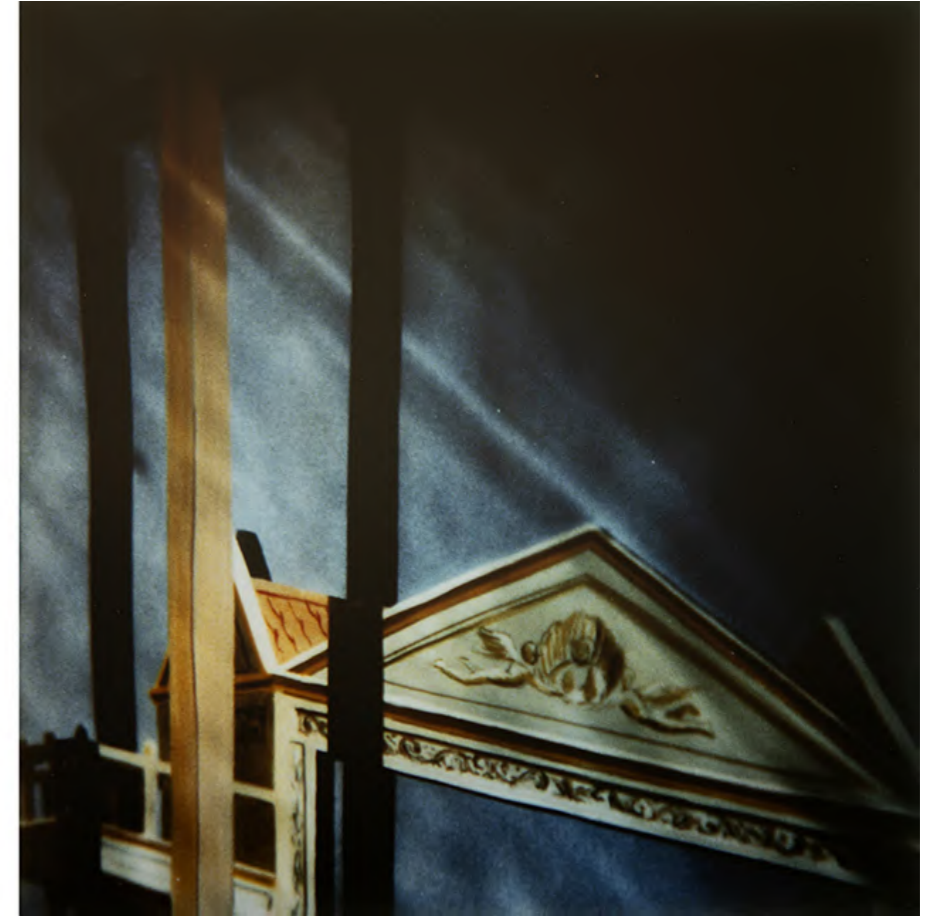
Corinne Mercadier, Triptyque bleu, série Polaroids-Photographies, 1985-86 peintures sur verre, polaroid SX70 rephotographié sur film Ekta 4/5 inch tirages Cibachrome, encadrement avec verre antireflets triptyque, pièce unique - 34 x 76 cm