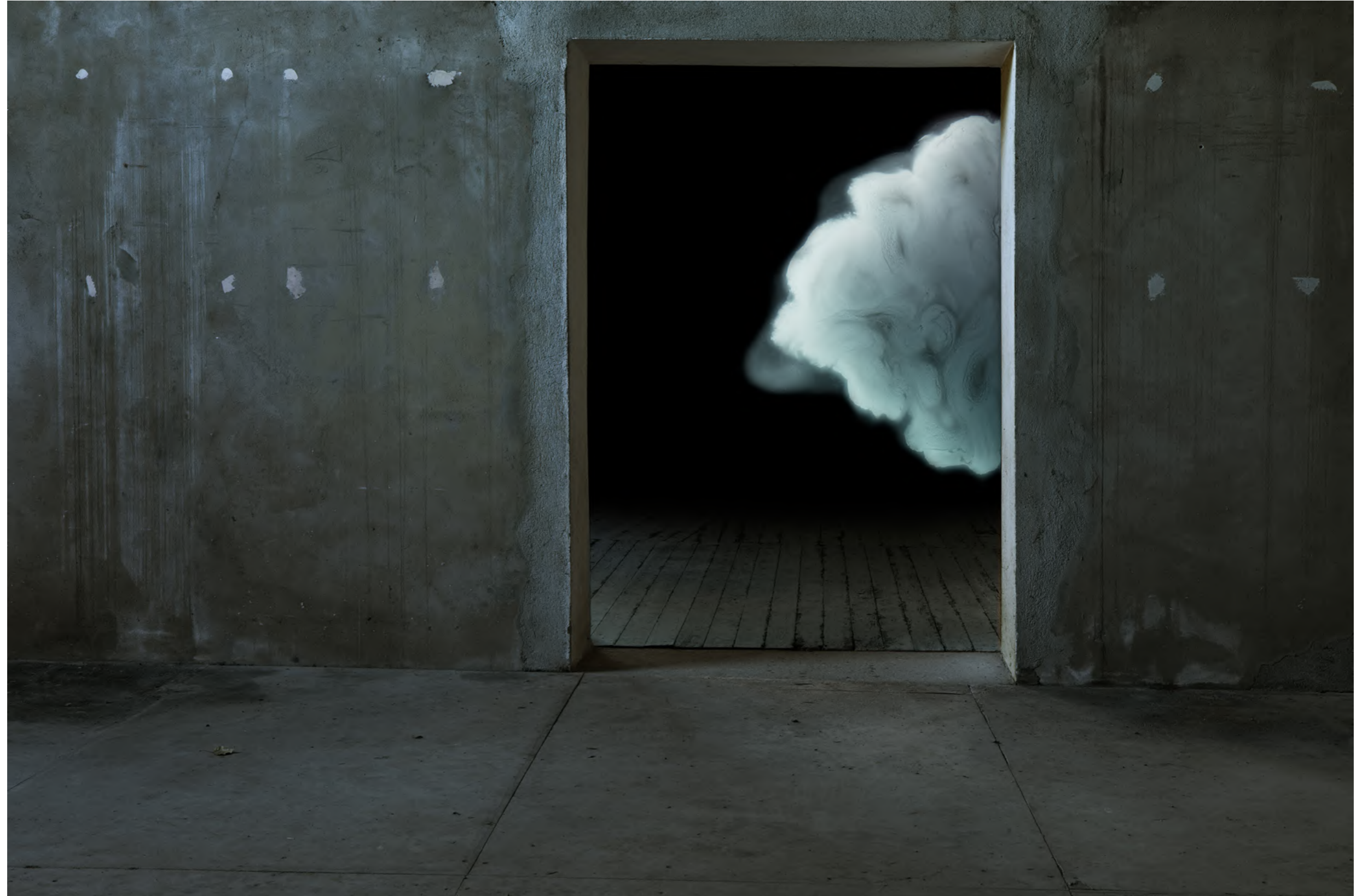
Corinne Mercadier, Le voir passer, série La nuit magnétique, 2022-24 peinture sur verre et photographies, tirage sur papier platine fiber rag Canson encadrement bois noir, verre antireflet, édition de 5 (+2EA) – 60 x 90 cm