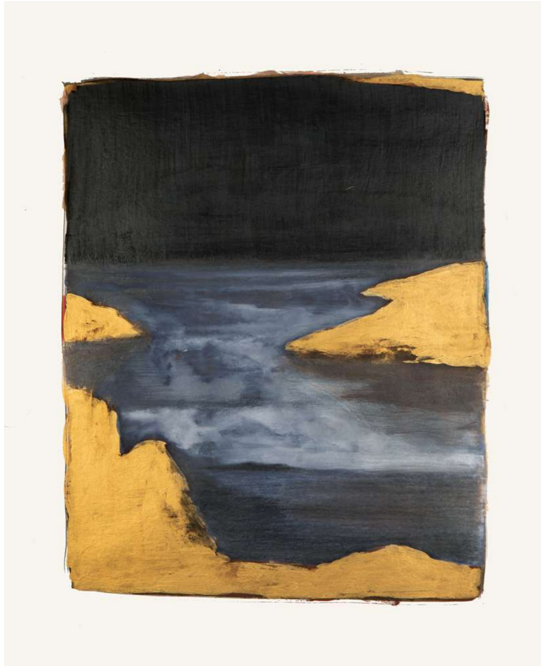
Corinne Mercadier, 39, série Rêves, 2023 encre, gouache, crayon de couleur sur papier Lavis Vinci encadrement et verre antireflet pièce unique - 42,5 x 36 cm