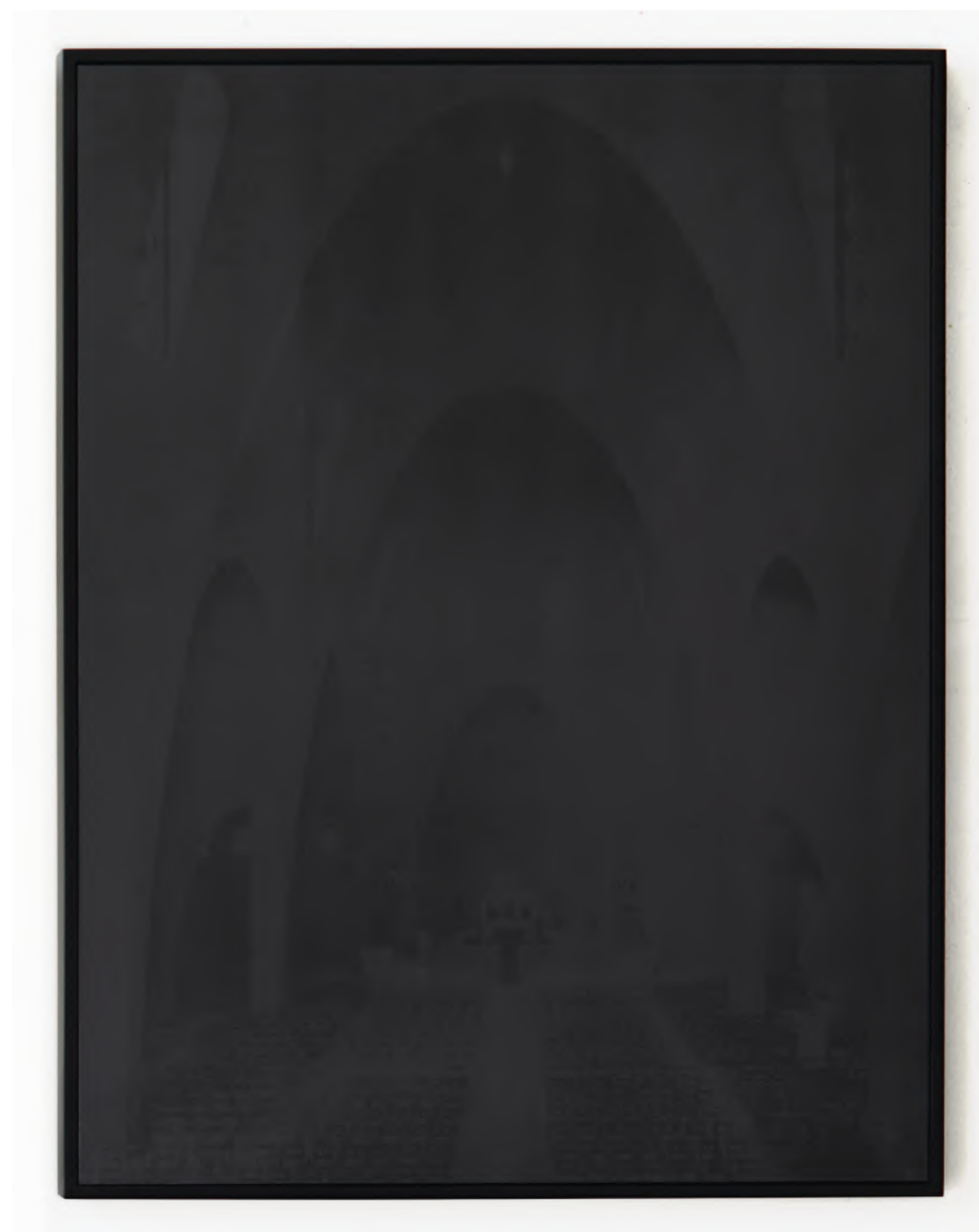
Laurence Aëgerter, Sainte-Jeanne-d'Arc de Nice série Cathédrales hermétiques, 2016 impression Ultrachrome sérigraphiée à l'encre thermo-sensible contrecollage sur Dibond, encadrement bois noir édition 5/6 (+2EP) - 85 x 65 cm