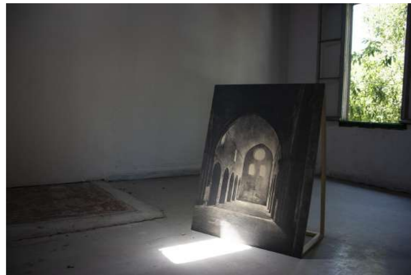
Laurence Aëgerter, Sénanque (révélé) , série Cathédrales hermétiques, 2019 Vue d'exposition « Cathédrales Hermétiques », Rencontres d'Arles 2019