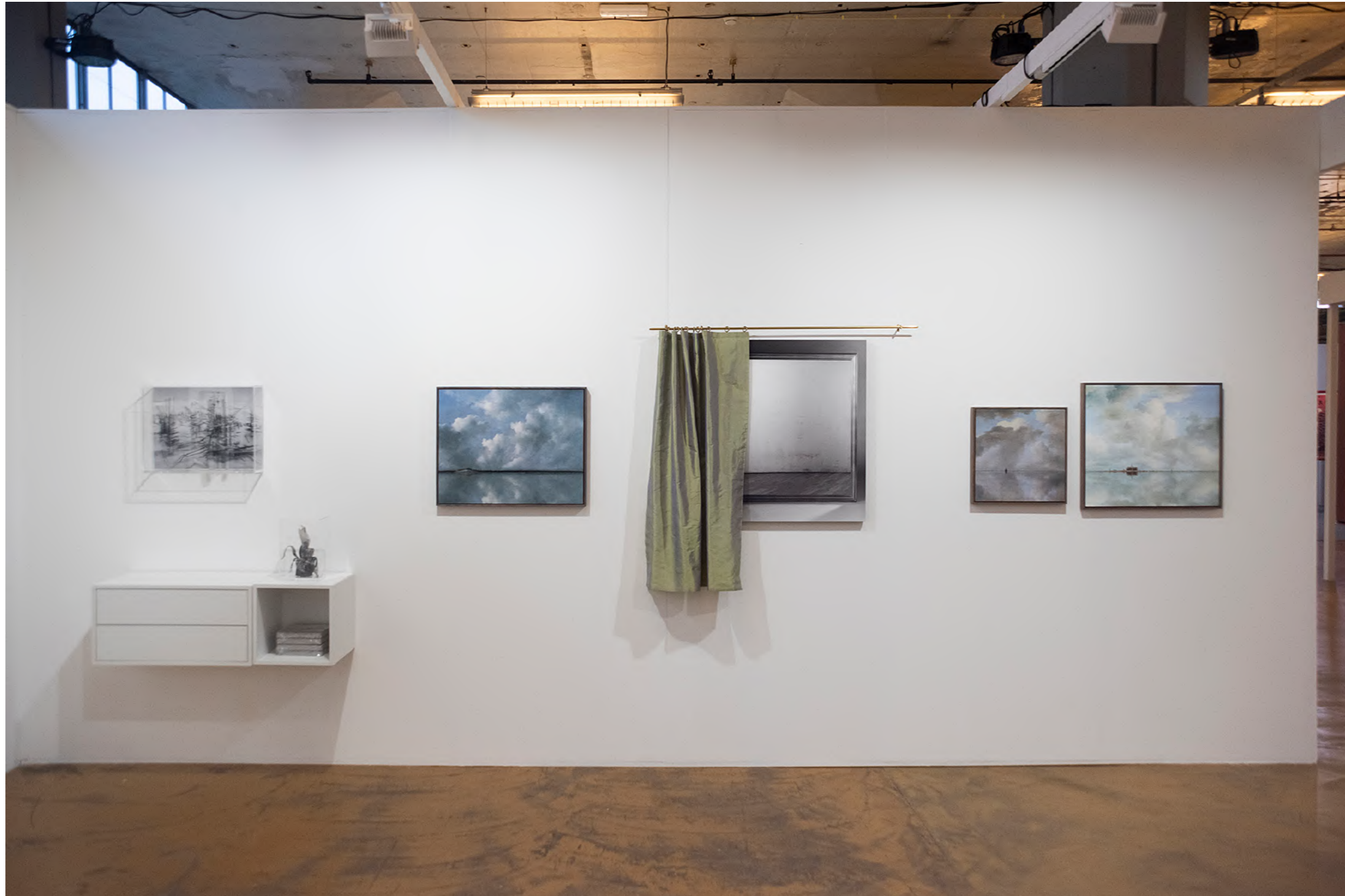
Laurence Aëgerter, Le miroir aveugle , 2023 Vue de stand, Art Rotterdam, 2024