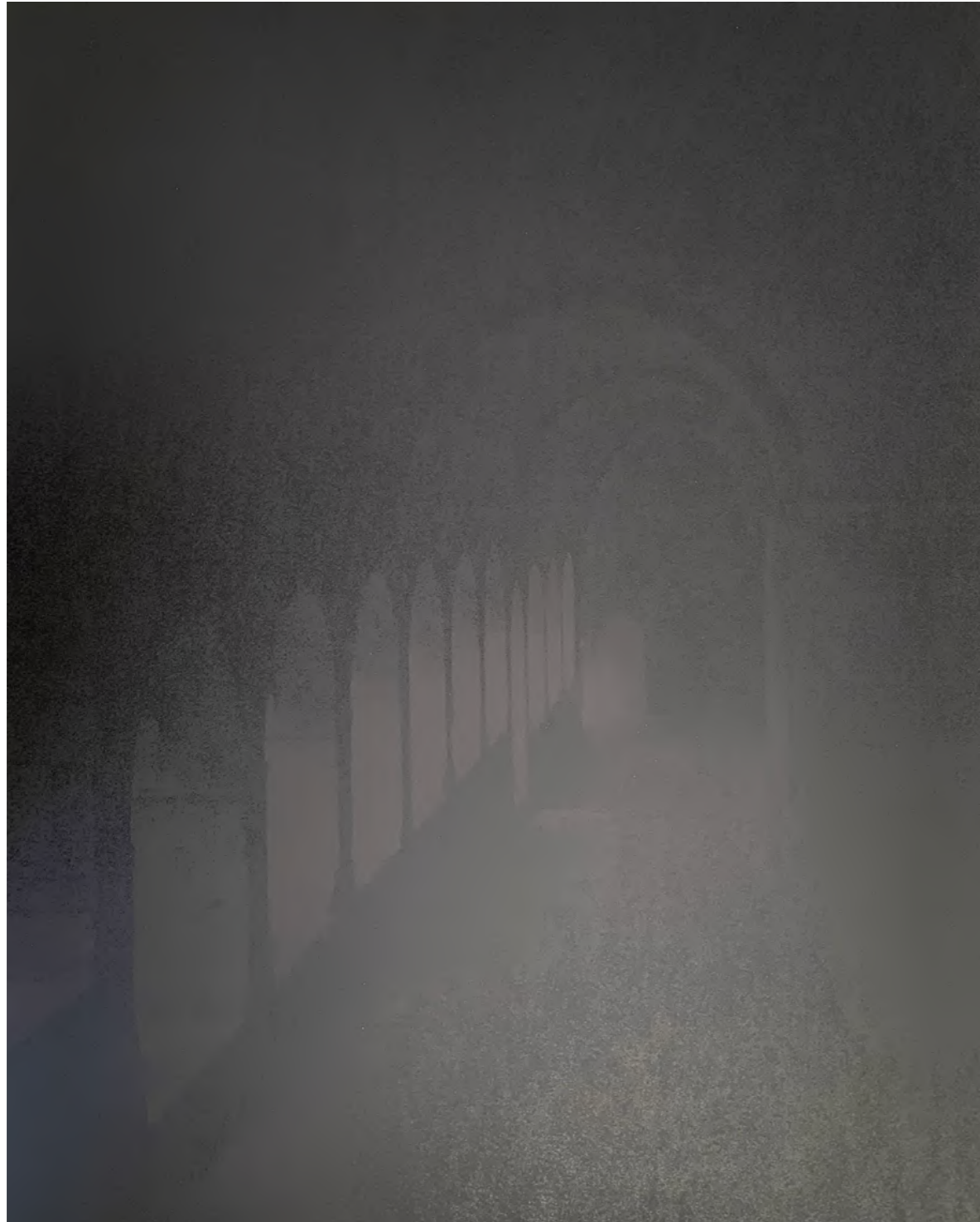
Laurence Aëgerter, Le Thoronet (cloître), série Cathédrales hermétiques, 2023 impression Ultrachrome sérigraphiée à l'encre thermo-sensible contrecollage sur Dibond, encadrement bois noir édition de 6 (+2EP) - 85 x 65 cm

CATHÉDRALES HERMÉTIQUES - LE THORONET (CLOÎTRE)