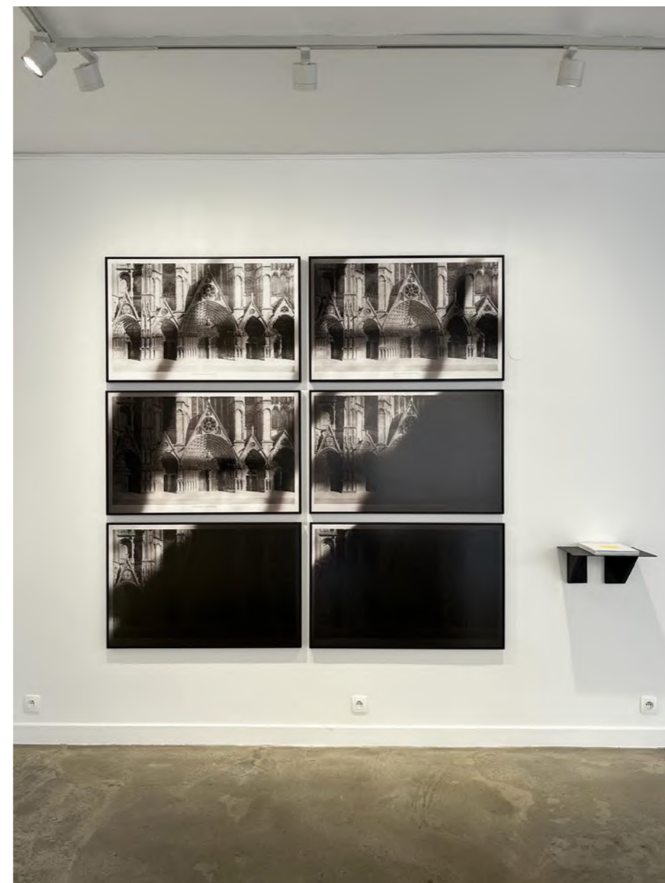
Laurence Aëgerter, série Cathédrales , 2014 Vue d'exposition « Éloge du double », Galerie Binome, Paris, 2022