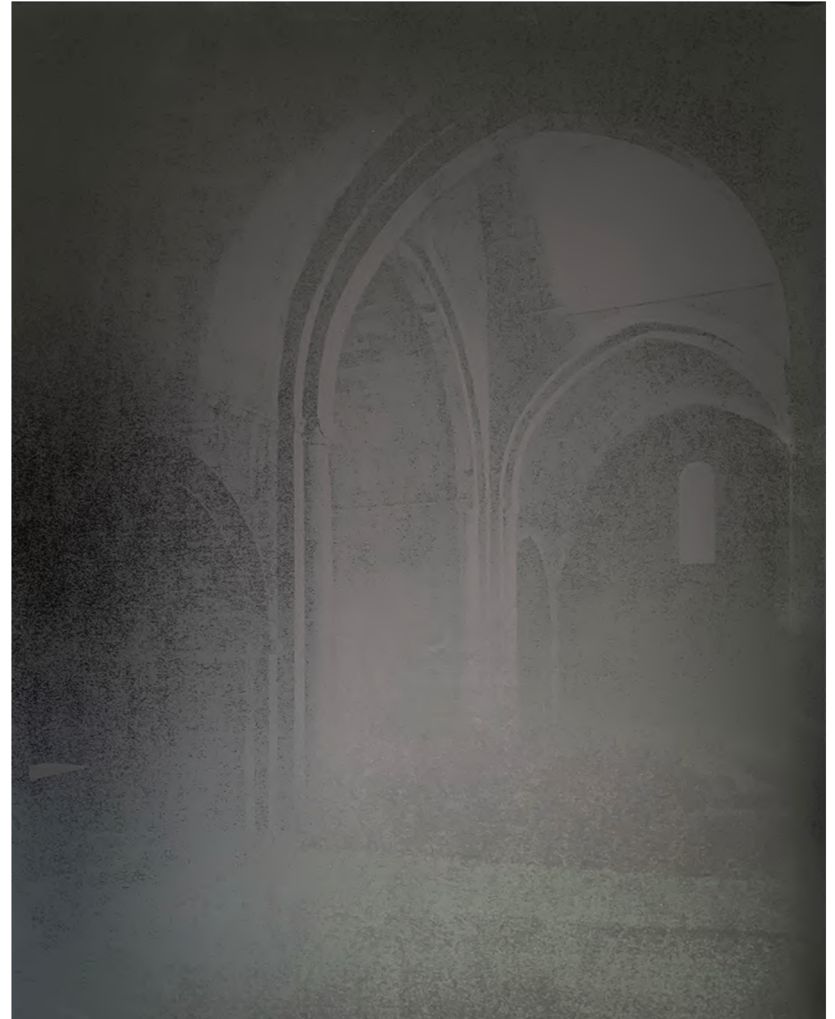
Laurence Aëgerter, Le Thoronet (transept), série Cathédrales hermétiques, 2023 impression Ultrachrome sérigraphiée à l'encre thermo-sensible contrecollage sur Dibond, encadrement bois noir édition de 6 (+2EP) - 85 x 65 cm

CATHÉDRALES HERMÉTIQUES - LE THORONET (CLOÎTRE)