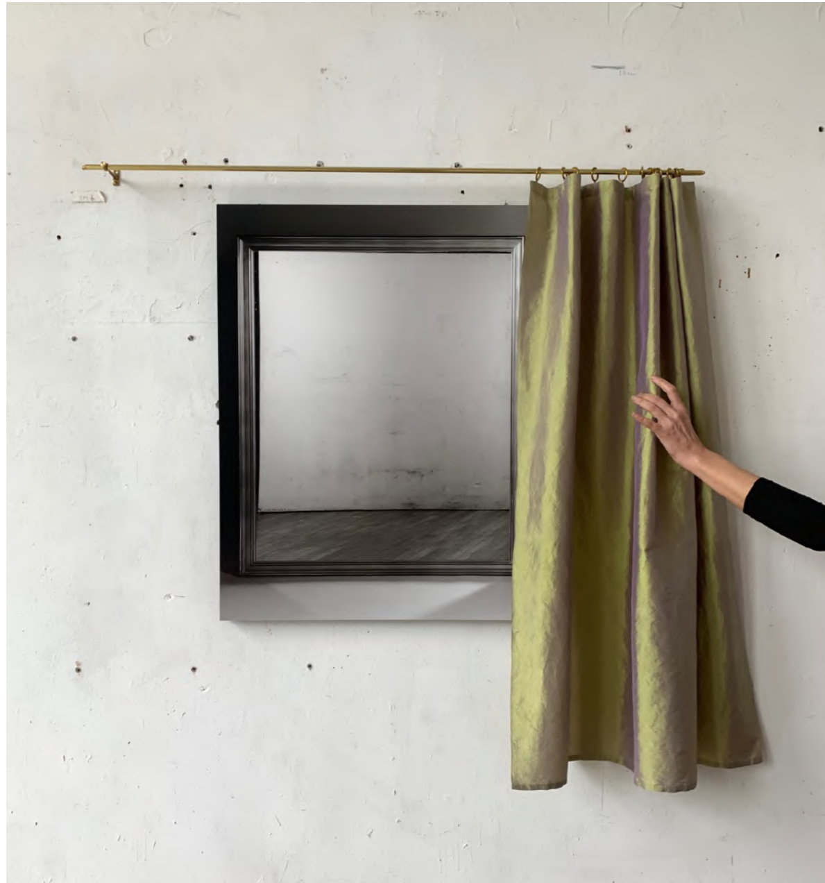
Laurence Aëgerter, Le miroir aveugle , 2023 impression pigmentaire d'archive sur papier Fine Art Baryta contrecollage sur Dibond, châssis aluminium rideau en taffetas de soie, tringle en laiton édition 3/6 (+2EA) - installation 117 x 122 cm - photographie 82,5 x 65 cm