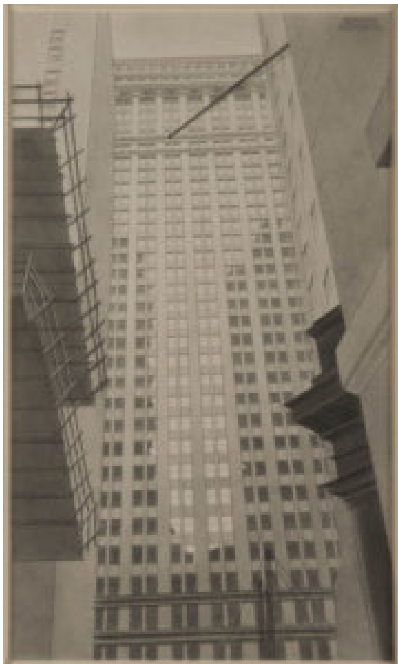
Bernard Boutet de Monvel, Building de Wall Street vue de New Street, 1930 Salon du dessin