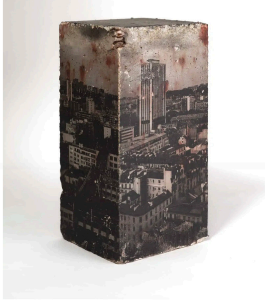
© Thomas Jorion, Monolithe #3, 2022, Galerie Esther Woerdehoff