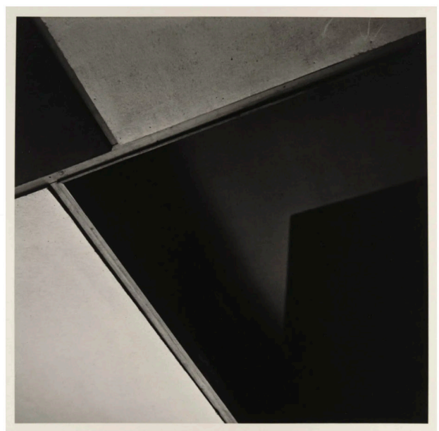
© Lucien Hervé, Cabanon du Cap-Martin (Le Corbusier), 1951, Courtesy Galerie Camera Obscura

Art Paris Art Fair. Du 30 mars au 2 avril 2023 au Grand Palais Éphémère, à Paris.