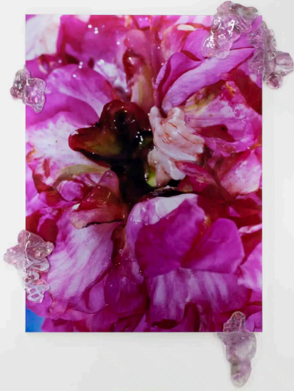
© Lucile Boiron, Partie humide I, Mater, 2022, Galerie Hors-Cadre