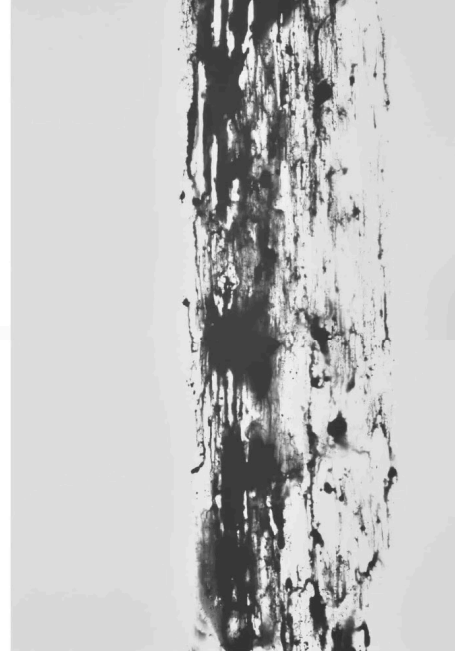
© Renato D'Agostin, Veni Etiam Aer 2, 2022, Biga