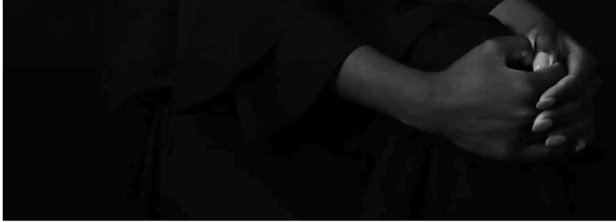
© Angèle Etoundi Essamba, Couronne en dentelle 2, 2020, Galerie Carole Kvasnevski