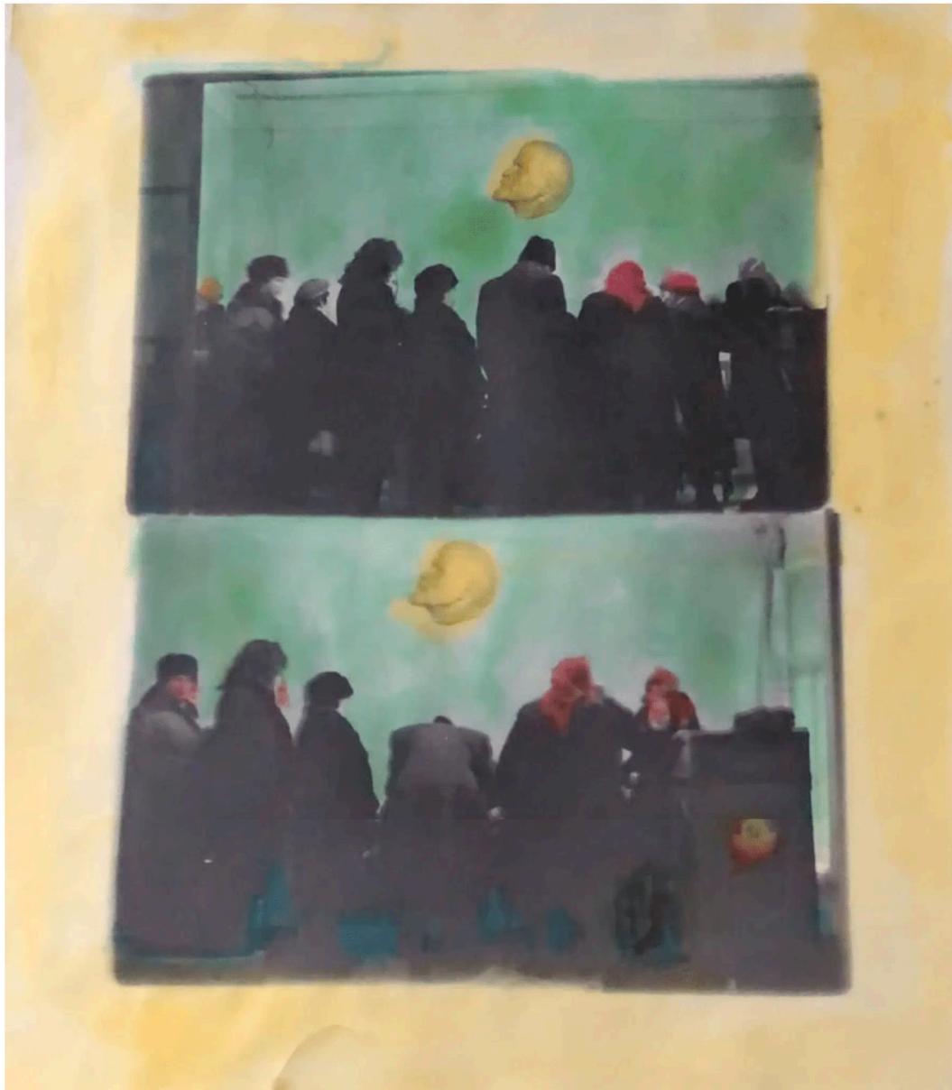
Sans titre, série Sots Arts, 1975-1986

Dans le même secteur, il ne faut pas rater Boris Mikhaïlov à la Galerie Suzanne Tarasieva. L'artiste ukrainien, lui, est resté dans son pays pendant l'époque soviétique malgré la difficulté d'exercer son métier dans cette période de privation de liberté. Inédite, sa série « Sots Art » réalisée dans les années 1975 à 1986 montre comment, par l'utilisation de l'aquarelle sur ses tirages photographiques noir et blanc, il est parvenu à transformer le réel en fiction, et ainsi échapper au joug de la censure.