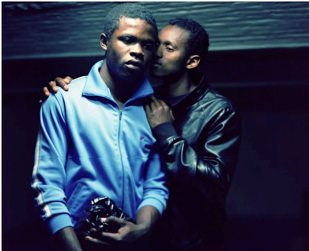
© Laura Henno, The Story Teller, 2012, Galerie Nathalie Obadia

Ces trois artistes ont en commun de mettre l'humain au cœur de leur analyse, que ce soit à travers des installations mêlant sculptures, photographies, vidéos et performances, une galerie de portraits en noir et blanc de facture classique ou des tirages grand format en couleur associés à des films.