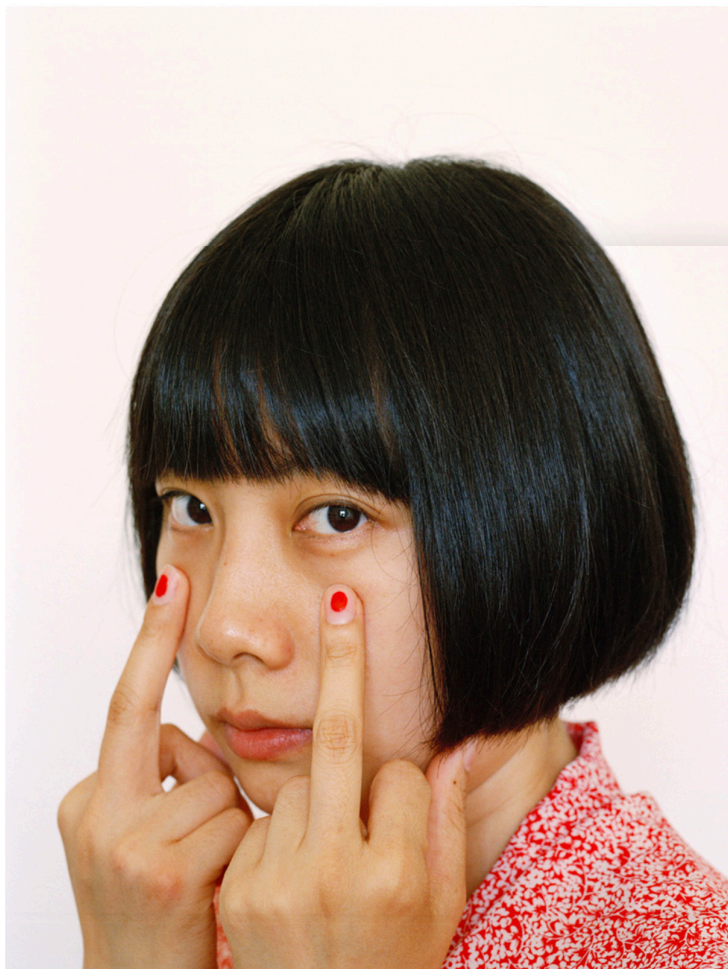
Pixy Liao, Red Nails , from the series Experimental Relationship , 2014

Née à Shanghai et établie à New York, Pixy Liao est une jeune plasticienne qui explore les thématiques de la jeunesse, de l'amour et du sexe. Souvent comparée à Ren Hang, tant dans son approche esthétique que dans sa liberté d'expression permise par la photographie, l'artiste n'hésite pas à provoquer le regardeur par des détournements d'objets et des mises en scène ludiques du corps humain, pour délivrer des messages à la douce insolence.