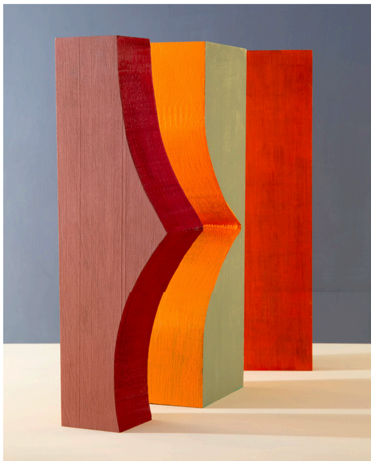
Erin O'Keefe, Nose to Nose, 2019

Conjuguant dimensions picturale et sculpturale, la photographe Erin O'Keefe (née en 1962 à Bronxville, New York) se considère aussi comme une architecte. Intéressée par la planéité de l'image, elle distord des figures abstraites tridimensionnelles par la couleur en se jouant des perspectives et de la profondeur permise par la pluralité des lignes.