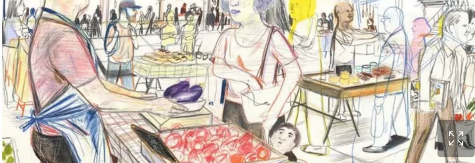
La Grande Halle, marché bio ce samedi au Pavillon de l'Arsenal. Yann Kebbi

• Marché bio. Dans le cadre de son exposition «Capital agricole» qui explore l'agriculture urbaine (jusqu'au 27 janvier), le Pavillon de l'Arsenal se transforme en grand «marché bio métropolitain» ce samedi. Une trentaine de producteurs franciliens en bio ou agriculture raisonnée (maraîchers, éleveurs, fromagers, boulangers, apiculteurs, confituriers...) font déguster et vendent en direct leurs produits, à consommer sur place ou à emporter (brunch, paniers pique-nique...). Des visites guidées de l'expo (à 15h et 17h) et des ateliers pédagogiques (6-14 ans, à 14h30, sur inscription) pour les enfants sont également proposés.