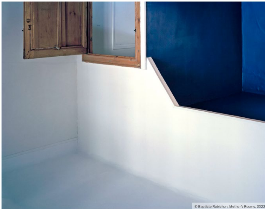
© Baptiste Rabichon, Mother's Rooms, 2022