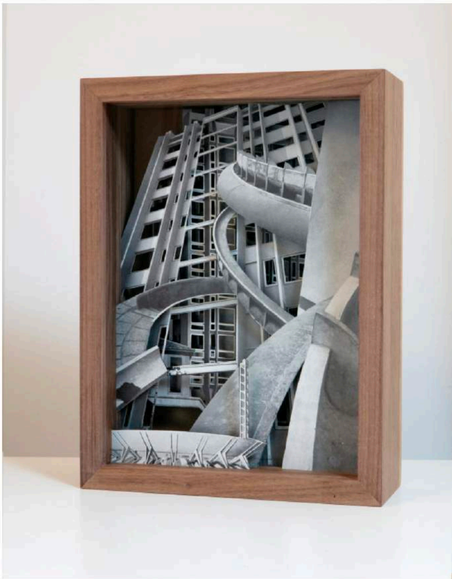
« L'Architettura n°32 2018 », collage papier, cadre en bois de Claudia Larcher. CLAUDIA LARCHER/GALERIE 22,48 M2

¶ Salon Approche, jusqu'au 30 mai chez Christian Berst Art Brut, Papillon et l'Espace Bertrand Grimont, Paris-3 e . Entrée gratuite sur réservation. approche.paris/