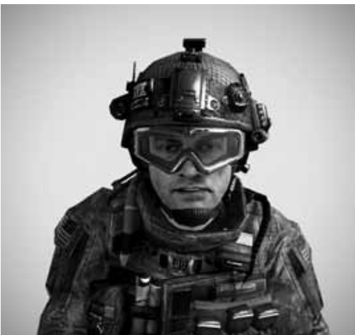
© Thibault Brunet, First person shooter Pvt Casey / 40 x 40 cm courtesy Galerie Binôme