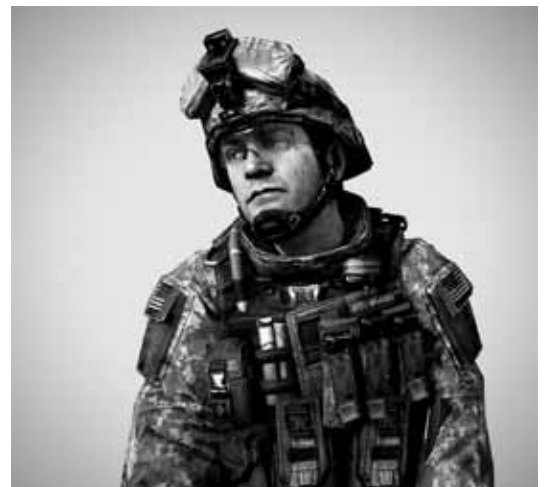
© Thibault Brunet, First person shooter Pvt Golden / 40 x 40 cm courtesy Galerie Binôme