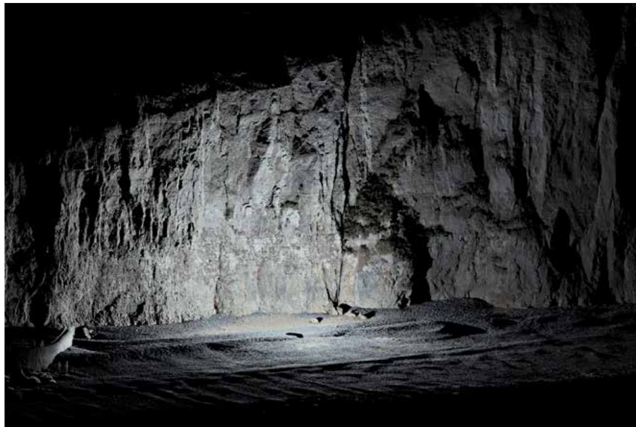
Thibault Brunet, sans titre #11, série Territoires circonscrits, 2017

édition de 5 (+2EA) - 100 x 200 cm tirage jet d'encre pigmentaire sur papier Epson Fine art coton smooth bright contrecollage sur Dibond, encadrement noir, verre antireflet