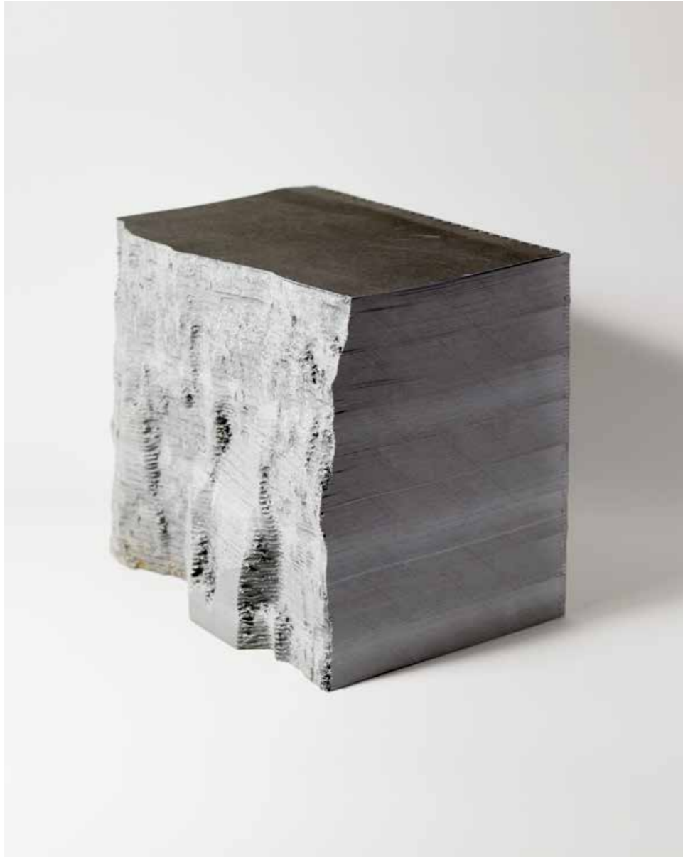
Thibault Brunet, AULT nord-est, 2019