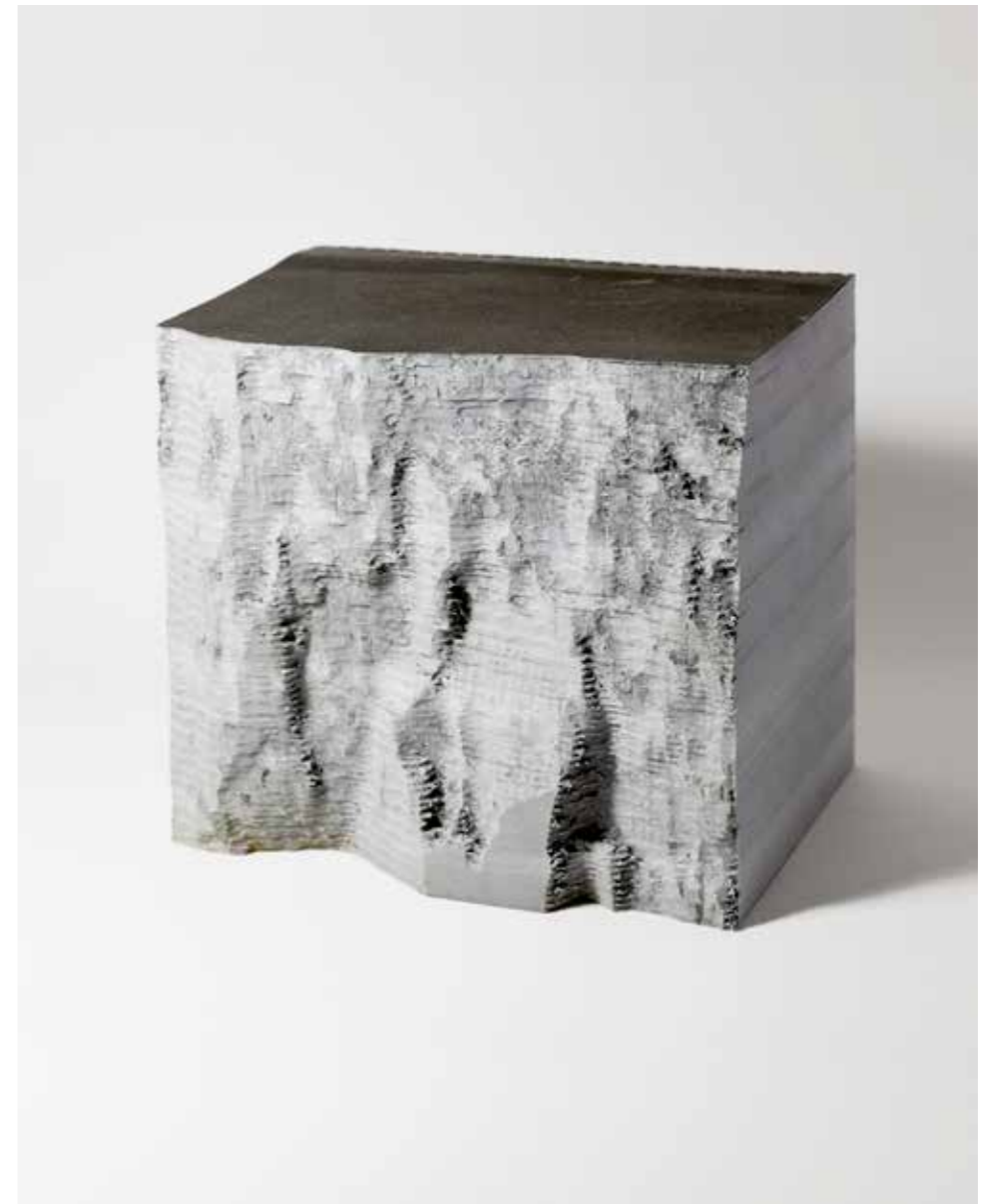
Thibault Brunet, AULT nord-est, 2019