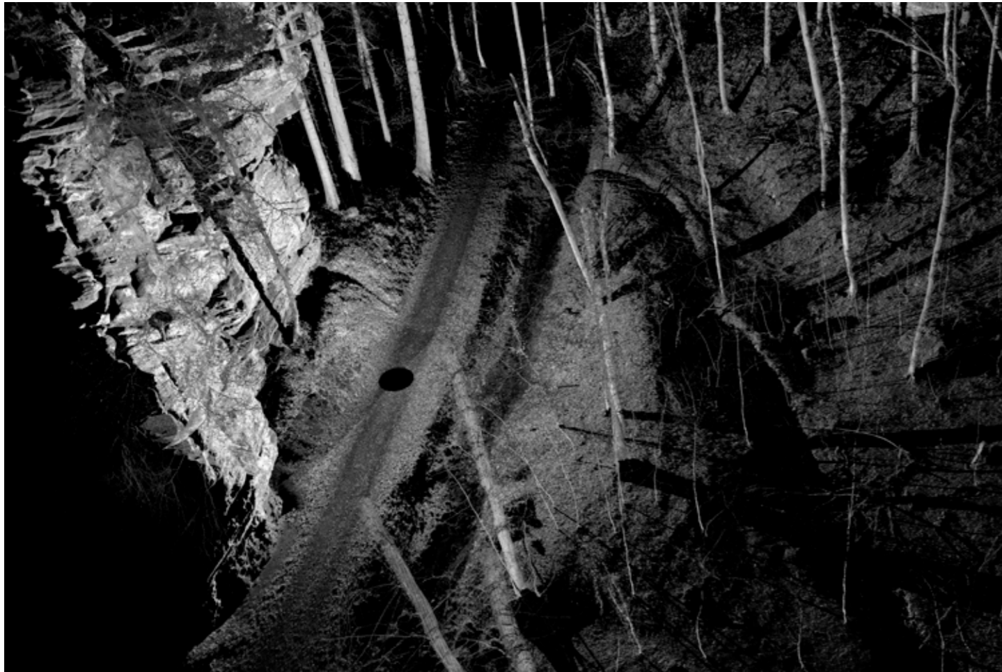
Thibault Brunet, Soleil noir #1, série Territoires circonscrits, 2019

édition de 5 (+2EA) - 50 x 70 cm tirage jet d'encre pigmentaire sur papier Epson Fine art coton smooth bright contrecollage sur Dibond, encadrement noir, verre antireflet