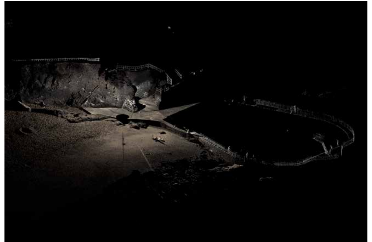
Thibault Brunet, sans titre #18, série Territoires circonscrits, 2019

édition de 5 (+2EA) - 100 x 150 cm tirage jet d'encre pigmentaire sur papier Epson Fine art coton smooth bright contrecollage sur Dibond, encadrement noir, verre antireflet