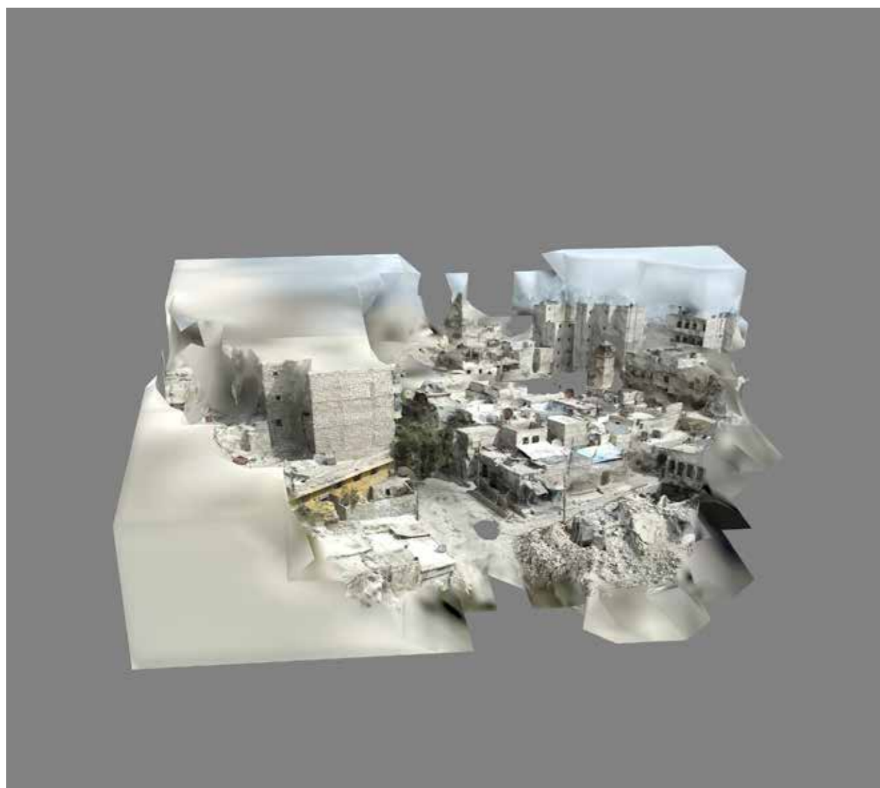
Thibault Brunet, sans titre #1, série Boîte noire, 2019

édition de 5 (+2EA) - 50 x 56 cm tirage jet d'encre pigmentaire sur papier Epson Fine art coton smooth bright contrecollage sur Dibond, encadrement bois laqué ton sur ton, verre anti-reflet