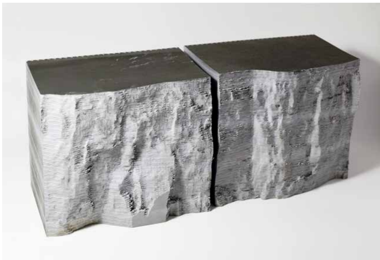
Thibault Brunet, AULT nord-est*, AULT sud-ouest, 2019 sculpture photographique produite par Mille Cailloux Edition

* Prix Révélation Livre d'artiste 2019 ADAGP / Multiple Art Days