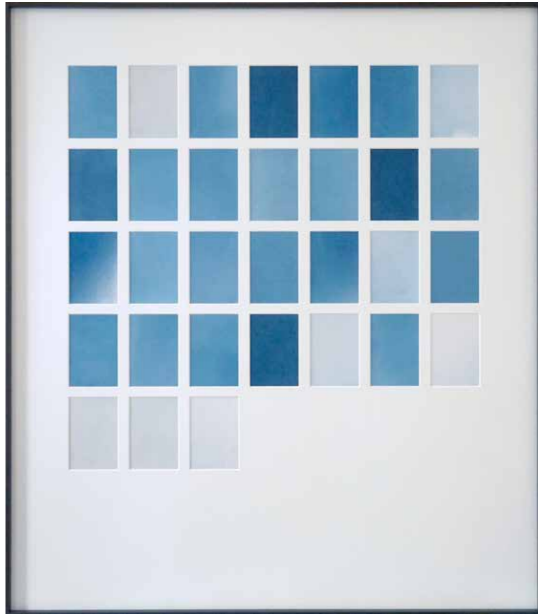
Marie Clerel, octobre 2018, série Midi, 2017-18

pièce unique dans une édition de 2 (+1EA) - 80,5 x 70,5 cm 31 épreuves au cyanotype sans contact sur papier blanc passe-partout, encadrement aluminium et bois plaqué, verre antireflet