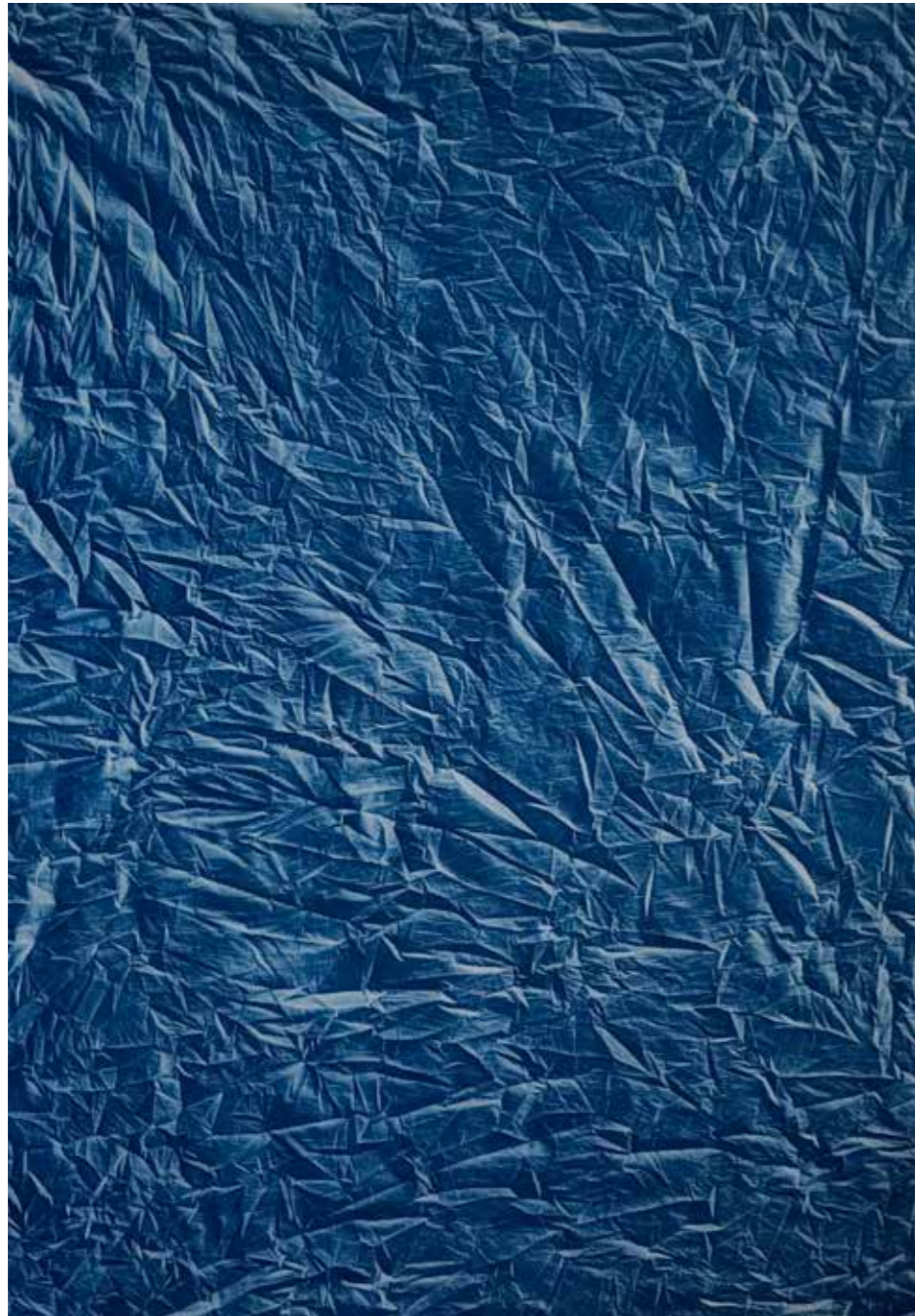
Marie Clerel, Sérignan, 26/09/18 17:00 série sans titre (ciels), 2016-18

pièce unique - 185 x 130 cm épreuve au cyanotype sur coton, châssis bois, encadrement boîte bois blanc