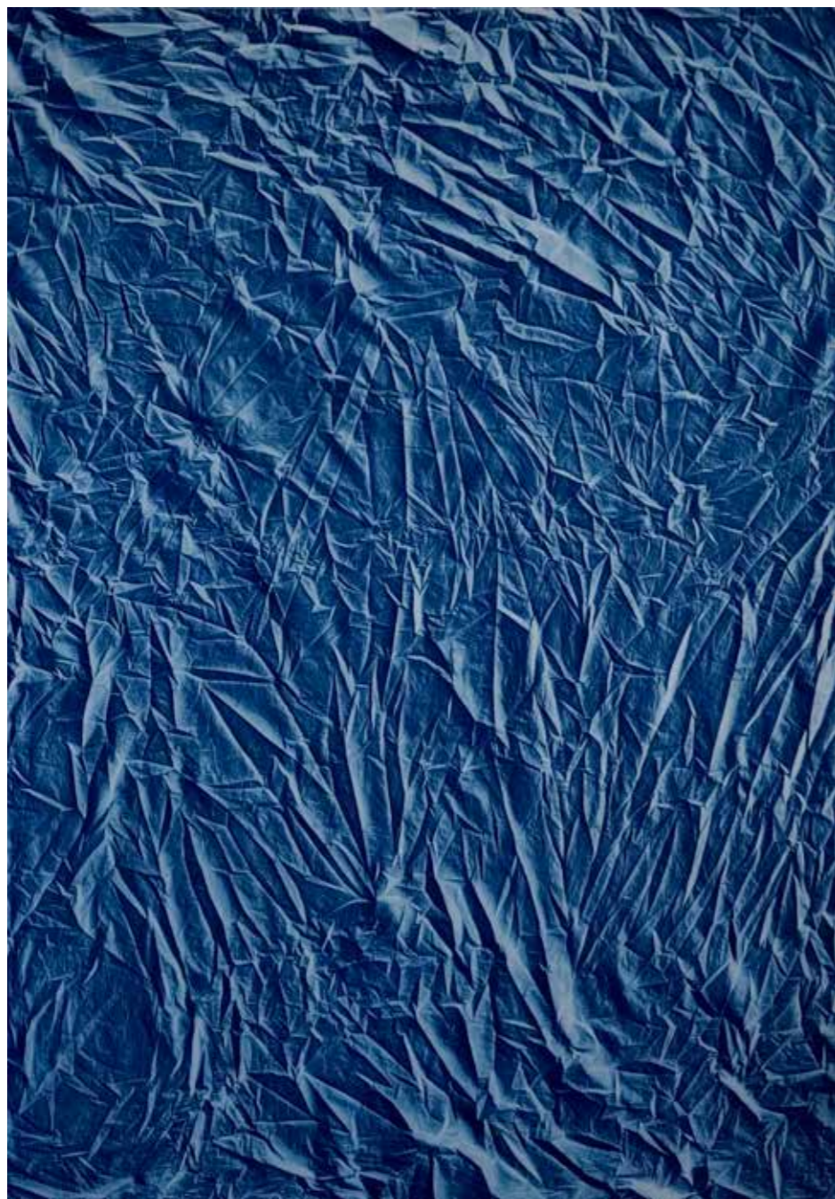
Marie Clerel, Sérignan, 29/09/18 16:30 série sans titre (ciels), 2016-18 pièce unique - 185 x 130 cm épreuve au cyanotype sur coton, châssis bois, encadrement boîte bois blanc