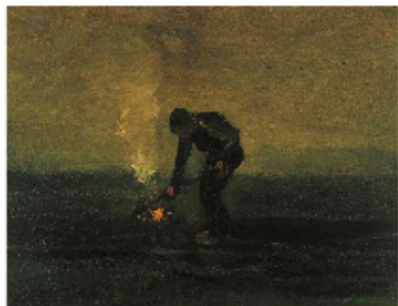
Van Gogh, Paysan brûlant de mauvaises herbes , 1883.