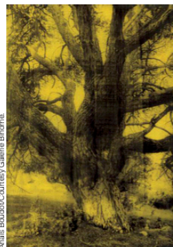
Anais Boudot/Courtesy Galerie Binome.