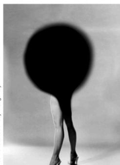
Noé Sendas/Courtesy mc2gallery.

Poursuivant sur le modèle qui a fait son succès - 4 600 visiteurs en trois jours, dont des institutions publiques et privées et des collectionneurs en 2018 -, le salon Approche, qui se tient du 8 au 10 novembre au moment de Paris Photo, a révélé les 14 artistes sélectionnés pour sa troisième édition, la plupart nés dans les années 1980. Douze d'entre eux sont représentés par une galerie, dont huit françaises (Binome, Papillon, Éric Mouchet...), deux italiennes (Ncontemporary, mc2gallery), une suisse (Bildhalle) et une sud-africaine (Afronova). Volontairement sélectif et à taille humaine, ce salon indépendant, qui se présente comme une exposition installée dans un hôtel particulier, est consacré au renouvellement des approches photographiques : de l'installation aux supports insolites en passant par l'appropriation. SOPHIE BERNARD approche.paris/fr