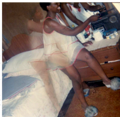
Lebohlang Kganye/Courtesy Afronova gallery.