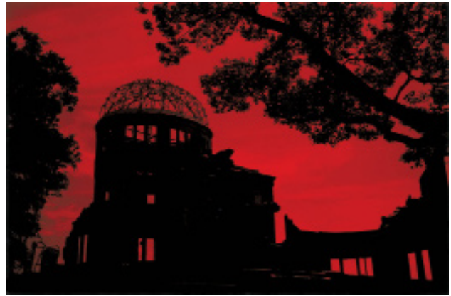
Melancholia / photographies et tirages argentiques 60 x 90 cm