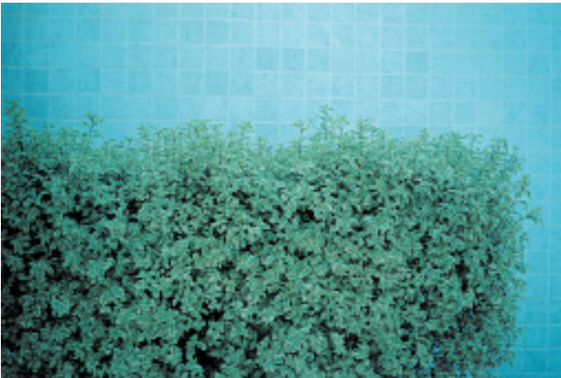
Convection A en 1 ère page & Convection C ci-dessus tryptique, extraits, photographies et tirages argentiques sous Diasec 88 x 132 cm

Photographe, vidéaste et écrivain, Jean-Louis Sarrans vit et travaille à Paris.