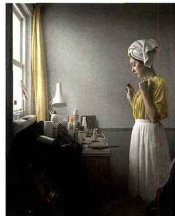
Maisie Broadhead, Isabella Study , 2014, impression numérique chromogène, 45 x 52 cm, éd. de 12.

PAD Paris Tuileries www.pad-fairs.com du 26 au 29-03