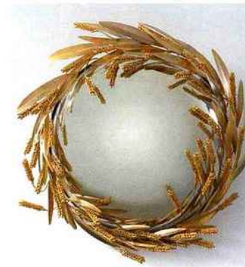
Robert Goossens, Miroir-sorcière avec une couronne d'épis de blé , réalisé pour Coco Chanel, 1972, bronze doré, diam. 60 cm.

DDessin Atelier Richelieu www.ddessinparis.com du 27 au 29-03