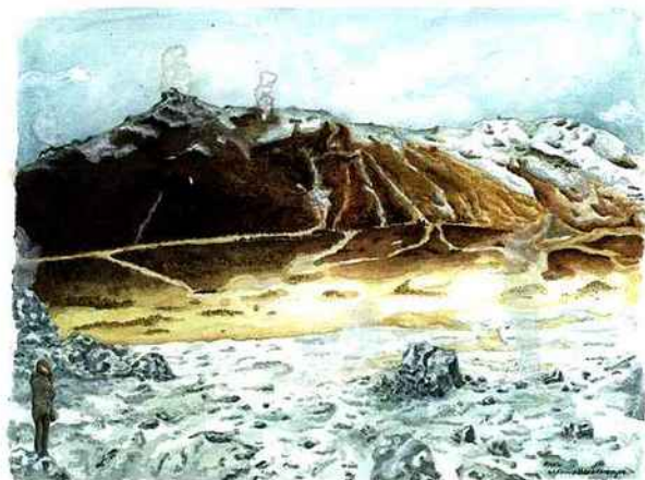
Johanna Thomé de Souza, Myvatn , 2014, crayon, aquarelle et gouache sur papier, 29,7 x 42 cm. © Johanna Thomé de Souza.